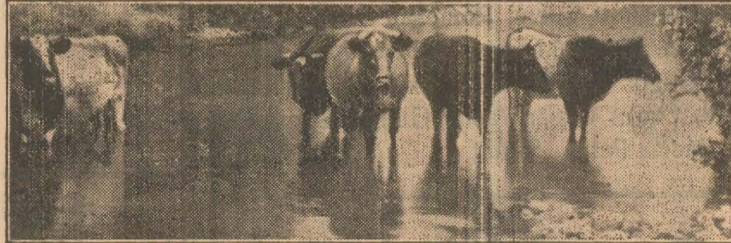
Vaci de soi elvețian.

8. Laptele muls va fi strecurat printr'o pânză, care va fi spălată după fiecare mulgere,