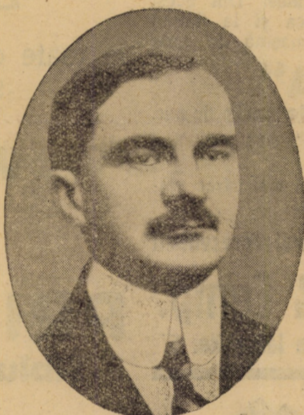
președinte de consiliu fără portofoliu. D. Iuliu Maniu