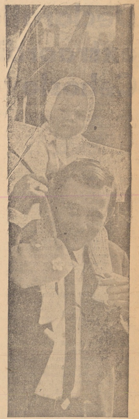
Cu tăcîțul la demonstrație

țării românești, tu partid să ne trăiești! — Iată rezultanta, unica rezultantă solemnă a roului de gesturi, de pași și de fapte aduse simbolic prin fața tribunei, în orașul de pe bătrînul Cîmbin. Lozinci împinzite printre coloane cheamă la unitatea mișcării comuniste muncitorești, la internaționalism. La orice pas impresia totală care-l rămîne în suflet poartă marca celui mai de preț dintre sentimente, dintre glînduri: recunoștința pentru partid, hotărârea neștirnută de-a sprijini cu umelile muncii nobile, constructive, cu brațul înarmat dacă va fi cazul, frumusețile inscripse cu dîrnicie pe fața orașelor și satelor noastre. Dînd glas gîndului adunat plenar în ecou unic nestăviluit, „Declarația Marii Adunări Naționale cu privire la principiile de bază ale politicii externe a României”, adoptată în sesiunea extraordinară de joi 22 august, reafirmă coordonatele esențiale ale întregii activități externe a partidului și statutului nostru, principiile care trebuie să stea la baza relațiilor dintre țările socialiste, a oricăror relații internaționale. Suveranitatea națională, neamestecul în treburile altor state, respectarea voinței fiecărui popor de a-și hotărî singur pașii de întreprins au fost și azi, la demonstrația oamenilor muncii sibiieni deziderate pe care toți ca unul le-am aprobat și susținut cu fidelitate.