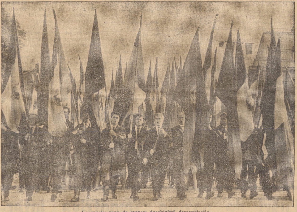
Un masiv grup de steaguri deschizînd demonstrația

ceastă uzină să producă agregate complexe pentru diminuarea efectelor secetei în Bărgan, Dobrogea și alte părți ale țării au fost îndeplinite. Sute și mii de agregate au ieșit pe poarta uzinei, contribuind la creșterea producției agricole în regiunile amintite. Animate de aceeași cauză, colectivele sibiene, începînd cu metalurgistii, textilistii și continuînd cu cei din industria alimentară, comerț, sectorul forestier etc., au raportat partidului și statului că sarcinile ce le-au revenit au fost nu numai îndeplinite dar și depășite. Ceea ce este semnificativ în acest an, față de cei precedenți, este faptul că produsele sibiene se bucură de o apreciere tot mai mare în competiția internațională. Progresul tehnic a fost prezent în coloanele cefeștilor, prin sugestivul panou în care două locomotive — una diesel-electrică și alta electrică, au luat locul celor cu aburi. Pegasul românesc de azi se deosebește radical de cel de ieri. Viteza și tonajul trenurilor au sporit față de anii trecuți. În cele 7 luni, cefeștii sibiieni raportează că au condus în condiții optime de siguranță peste 8 000 trenuri de călători și 13 000 trenuri de marfă. În marea epopee contemporană de desăvîrșire a socialismului, construcțiilor au un loc aparte. Sînt oameni care înnoiesc țara, o împinzesc cu schele, ridicînd uzine și fabrici, cartiere întregi de locuințe, șosele modernizate, magistrale electrice. Con-