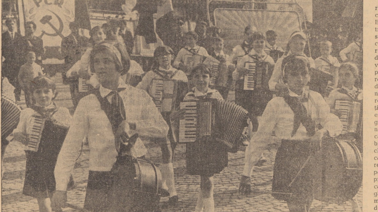
În ritmul exuberantelor cîntece din minunatul anotimp al copilăriei...

Pe pancartele ridicate, în lozincile și uralele scandate, intelectuali Sibiu și-au manifestat adeziunea totală față de politica partidului, angajată deplin în interesele vitale ale poporului român, în construcția desfășurată a comunismului — această opțiune fundamentală a națiunii noastre. Trecerea lor prin fața tribunei a fost întîmpinată cu vii aplauze, marcînd considerația și stima cu care-i înconjoară partidul, întrea-ga societate.