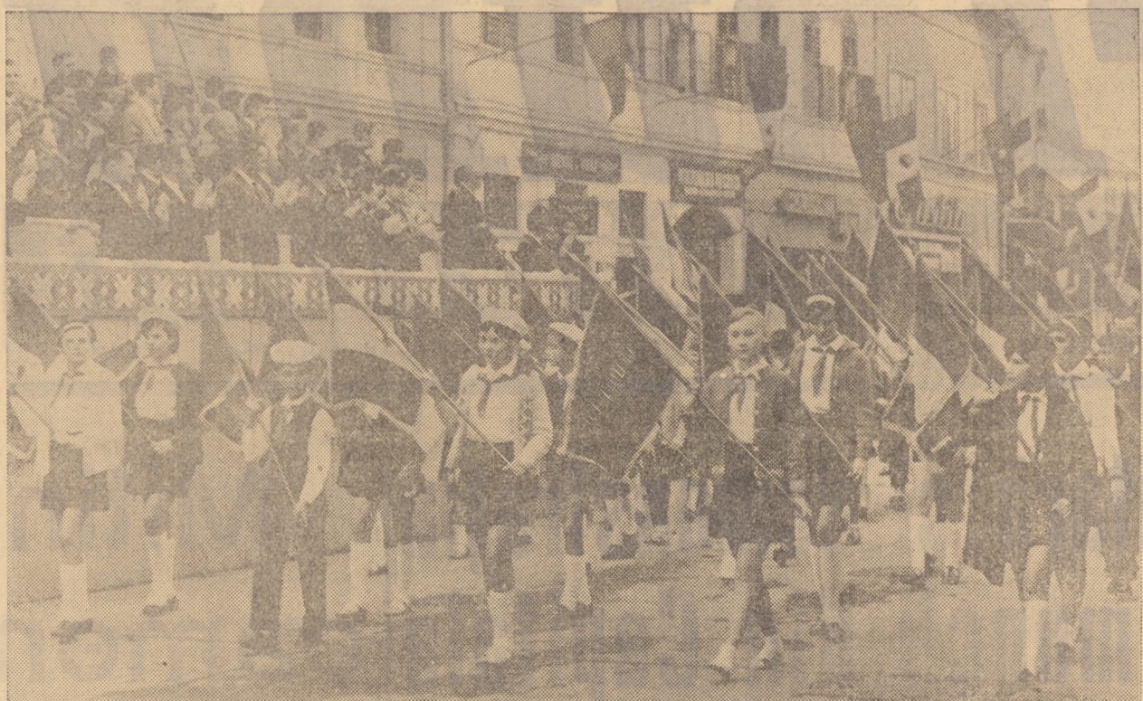
Coloana pionierilor și școlărilor din orașul Mediaș în timpul demonstrației

Întregul oraș, îmbrăcat sărbătorește, pare mai frumos, ca oricînd. Încă din primele ore ale dimineții, grupuri de oameni, îmbrăcați în strale de sărbătoare, în acordurile marșurilor fanfanelor, cu lozinci și pancarte, grafice, steaguri, străbat arterele principale îndreptîndu-se spre Piața Republicii.