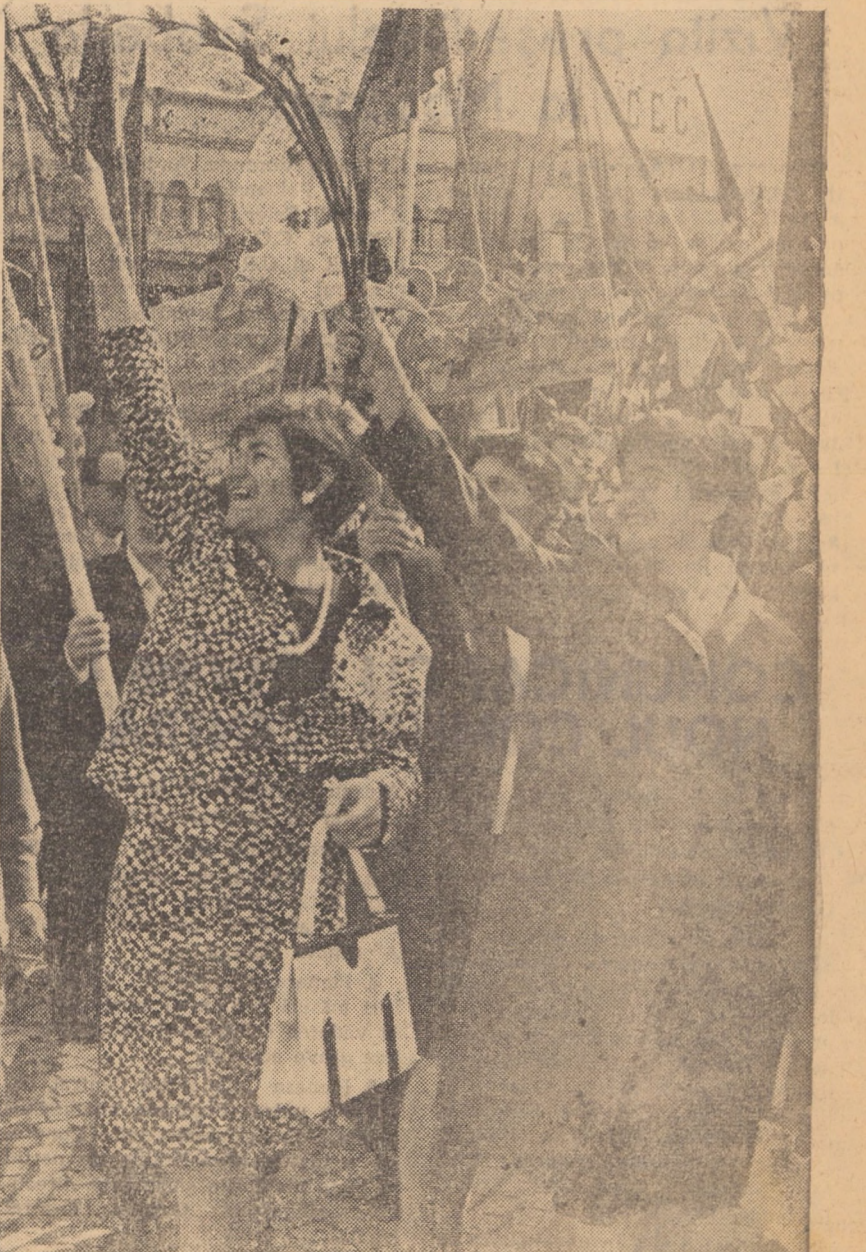
Din toată inima — calde salutări tovarășești, prietenești

Acum, la a 24-a aniversare a eliberării, se cuvine să aruncăm o privire înapoi — „Cu cele trecute să precepem cele viitoare”, cum spunea bătrînul cronicar Miron Costin. Din