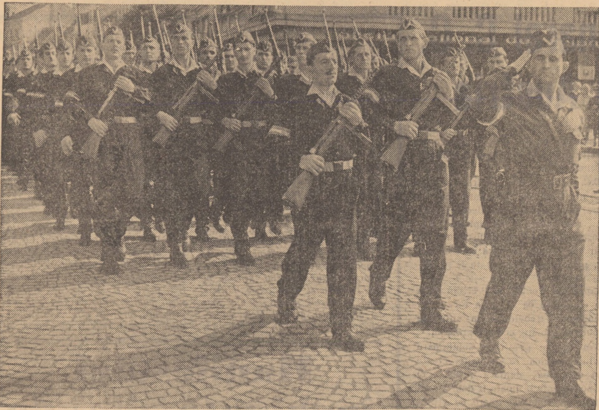
Un grup de membri ai găzilor patriotice — muncitori, țărani, intelectuali — animai de hotărârea fermă de a fi apărători de nădejde ai patriei noastre socialiste