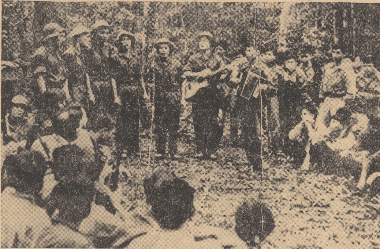
VIETNAMUL DE SUD. Oră de răgăz la sărbătorirea unui nou succes pe cîmpul de luptă într-un deplasament al patrioților care acționează în districtul Quang Tri

Biroul Politic va da ulterior o apreciere mai detaliată, pe baza unui examen aprofundat al clauzelor acestui acord și al informațiilor care îi vor parveni.”