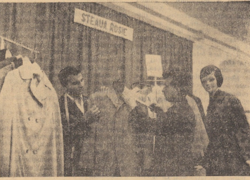
In sala de prezentare, creatorii de modele fac ultimele retușuri

— Prin magazinul dumneavoastră se desfac mărfuri produse de Fabrica de confecții „Steaua roșie” Sibiu? — Da. Avem un bogat sortiment de costume bărbătești și pentru adolescenți, pantalonii și raglane bărbătești „Novosin” și „Tercot”. — Care este părerea consumatorilor despre mărfurile fabricate sub această marcă? — Sînt foarte căutate. Au fost dese cazurile cînd cumpărătorii ne-au solicitat în mod special confecții de la această fabrică. Colectivul de creație al întreprinderii este receptiv la cerințele model, prezentînd o gamă variată de modele, din articole de stofe în culori, țesături, contexturi cît mai solicitate. — Și acum care sînt propunerile dumneavoastră pentru o și mai bună deservire și satisfacere a gusturilor populației? — Dacă mi se oferă această ocazie am să fac unele propuneri, bineînțeles în baza cererilor ce ni s-au făcut de către consumatori. Am dori să se confecționeze pantalonii din stofe mai ieftine. Sînt foarte căutați pantalonii din P.N.A. sau din stofe de lînă în amestec cu fire sintetice. Totodată se așteaptă costume pentru adolescenți din aceleași articole ieftine și foarte rezistente la uzură.