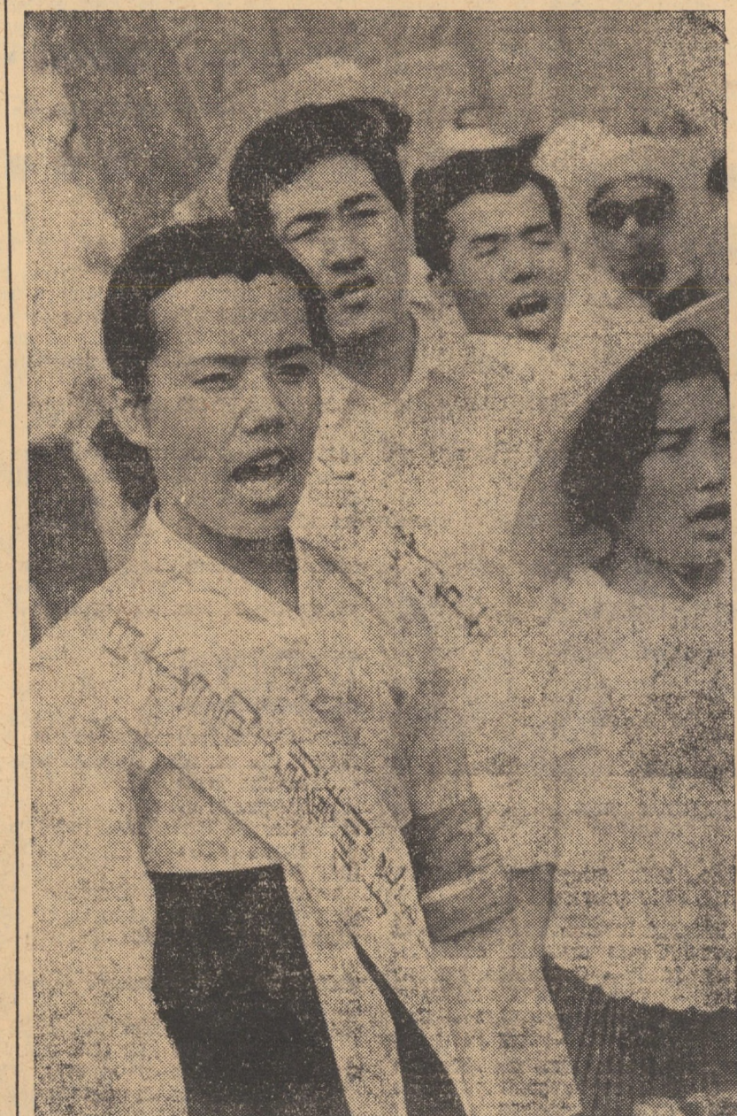
JAPONIA. Recent, la Tokio celălenii coreeni au demonstrat cerind autorităților japoneze să accelereze lucrările de reparație a persoanelor coreene și a ajunsă din nou în patrie, lucrări tergiversate de mai mulți ani. Aspect al demonstrației persoanelor coreene dorind să fie repatriate

La ședința Comitetului nostru Executiv de sîmbătă noi am declarat că, pentru a se realiza o soluție, trebuie să fie restabilită funcționarea normală a guvernului cehoslavoav și a Partidului Comunist Cehoslavoav și trupele să fie retrase. Urmă Partidului Comunist din Cehoslavia — spune declarația — succese în îndeplinirea programului său, în consolidarea socialismului și înfrîngerea forțelor antisocialiste în țara lui. Noi primim înaintea depășirea fermă a problemelor existente între R.S. Cehoslavoav și alte state socialiste, întrucît apărarea sistemului socialist depinde de unitatea lor și de cooperarea lor voluntară. Avem nevoie de cea mai mare unitate a tuturor forțelor progresiste, a tuturor statelor socialiste și de cea mai deplină cooperare între Partidul Comunist al Uniunii Sovietice și toate celelalte partide comuniste” — se spune în continuare în declarație.