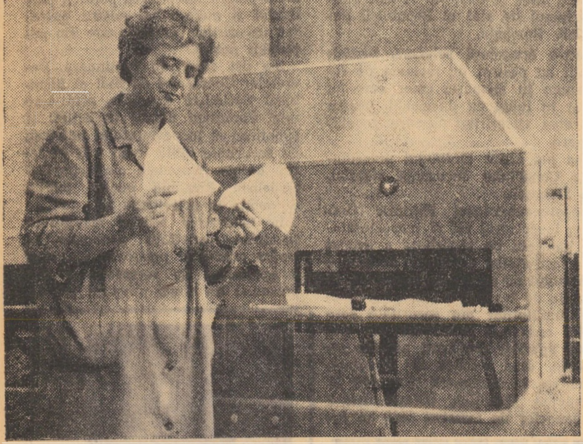
Mașina de confecționat pernele, concepută și construită de colectivul serviciului mecanic șef