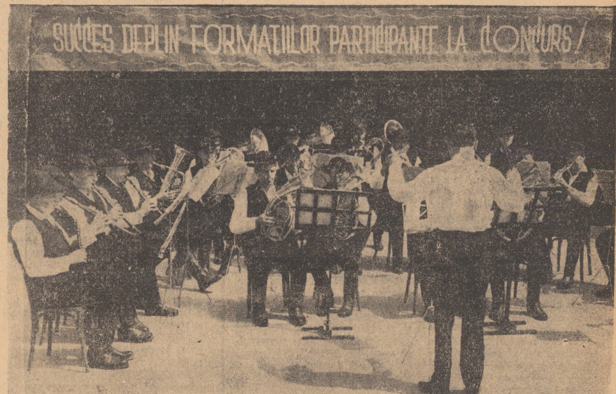
Fanara Cîmîntului cultural din Apoldu de Sus