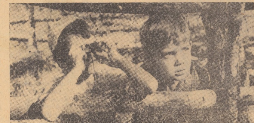
Cadru din filmul FANTEZIȘTII, care rulează la cinematograful „Tineretului” din Sibiu

SIBIU: PACEA: Șapte oameni de aur (orele 9,00, 11,30, 13,00, 16,30, 19,00, 21,00); VICTORIA: Moștenirea lui Achile (orele 9,00, 11,00, 13,30, 16,00, 18,30, 21,00); TINERETULUI: Fanteziștii (orele 10,00, 12,00, 14,30, 16,30, 18,30, 20,30); INDEPENDENȚA: Eroii de la Telemark (orele 11,00, 14,30, 16,30, 18,30, 20,30); 7 NOIEMBRIE: Capcana (orele 10,00, 14,00, 16,00, 18,00 și 20,00).