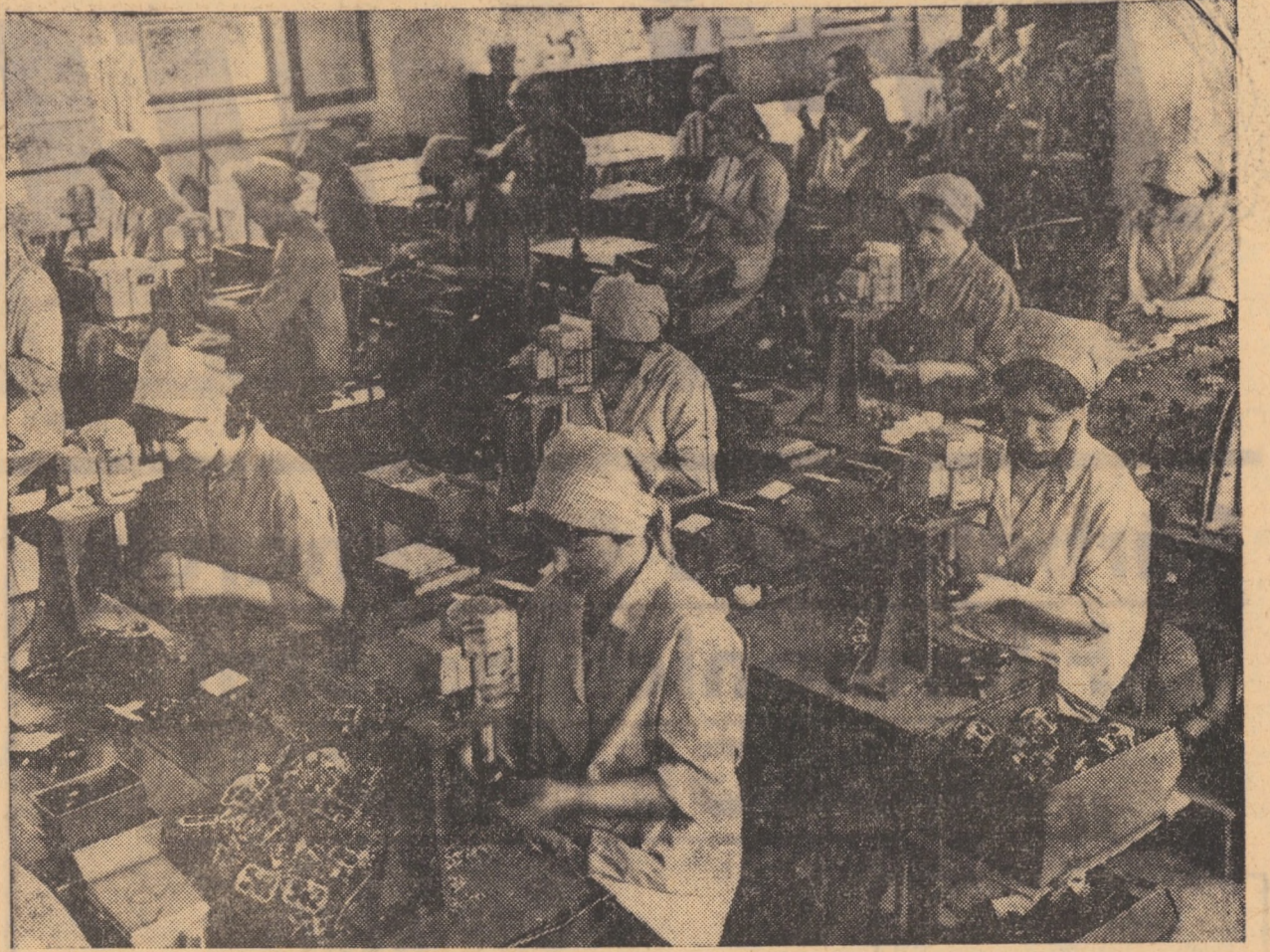
Aspect din secția montaj a Întreprinderii de aparatură electrică din Medias.