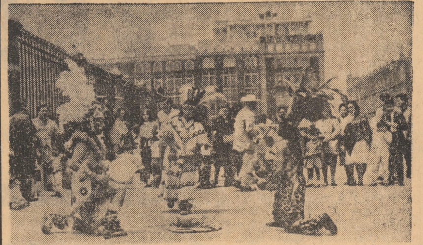
Dansuri naționale pe străzile orașului Ciudad de Mexico inițiază pe turiști și sportivii străini în tainele frumoaselor dansuri de origine străveche

Saigon 16 (Agerpres). — Zece persoane au fost ucise și 23 rănite ca urmare a bombardării de către artileria americană a unei localități sud-vietnameze din apropiere de Thuong Duc considerată evacuată. În această zonă, forțele patriotice au menținut, după cum se știe, timp de aproape două săptămâni, sub asediu o tabără a „beretelor verzi” americane.