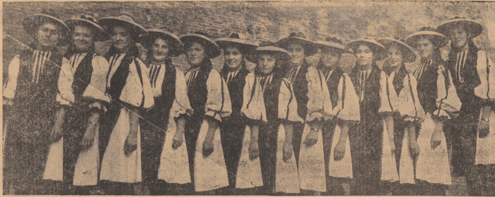
Grupul vocal feminin al căminului cultural din Mohu, al cărui mod original de interpretare a cîntecului strămoșesc „Buzduganul” s-a bucurat de elogioase și unanime aprecieri

Consider că discuțiile în grup pe teme concrete și bazate pe studii elaborate de diferitele colective din întreprinderi au un efect pozitiv asupra răspândirii acestei experiențe, contribuind la generalizarea studiilor aduse în discuție. După astfel de discuții vom căuta ca rezultatele să le popularizăm prin organul de presă local, pentru suscitarea interesului general.