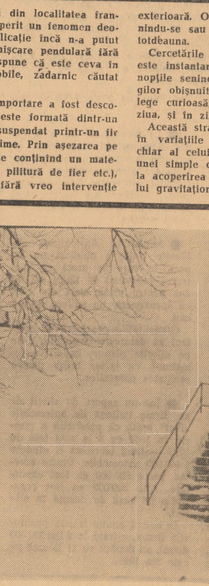
Alb. Alb nesfîrșit, sfîșiat rîzleț de trunchiuri vinjoase de arbori și de seculare ziduri girbovite sub manta altor ierni...

Această stranie mișcare își are probabil originea în variațiile cîmpului gravitațional terestru sau chiar al celui cosmic și nu este exclus ca, grație unei simple constatări întâmplătoare, să se ajungă la acoperirea unor pete albe din domeniul cîmpului gravitațional.