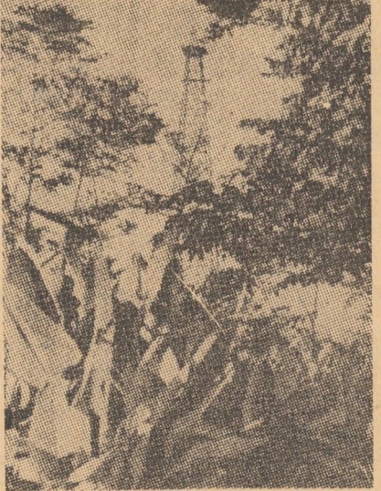
O siluetă de sondă apărută în luxurianta vegetație a pădurii columbiene

● În cursul anului trecut, profiturile firmei, cifrate la 2 128 000 000 dolari, au depășit cu 11 la sută pe cele din 1967.