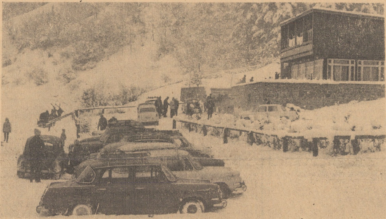
Fie numai în trecere spre culmile stațiunii Păltiniș sau, tura” din frumoasa Vale a ștezii, cunoaște în aceste zile oareca destinație într-o mică excapație, cabana „Curmă” o mare afluență a amatorilor de schi

În telegrame adresate conducerii de partid, tovarășului Nicolae Ceaușescu, ei dau glas acestei mulțumiri și se angajează să muncească în așa fel încît să răspundă cu cinste înaltei aprecieri de care se bucură, în România socialistă, cei ce slujesc școala, nobilele ei întreprinderi.