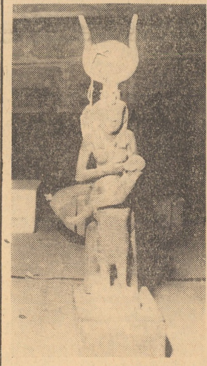
R.A.U.: Statuetza zeiței Isis cu fiul ei Horus în brațe, descoperită recent

Cu toate că la negocierile dintre reprezentanții greviștilor și ai conducerei agenției A.P. a participat vineri și un mediator federal, nu s-a putut ajunge la nici un acord.