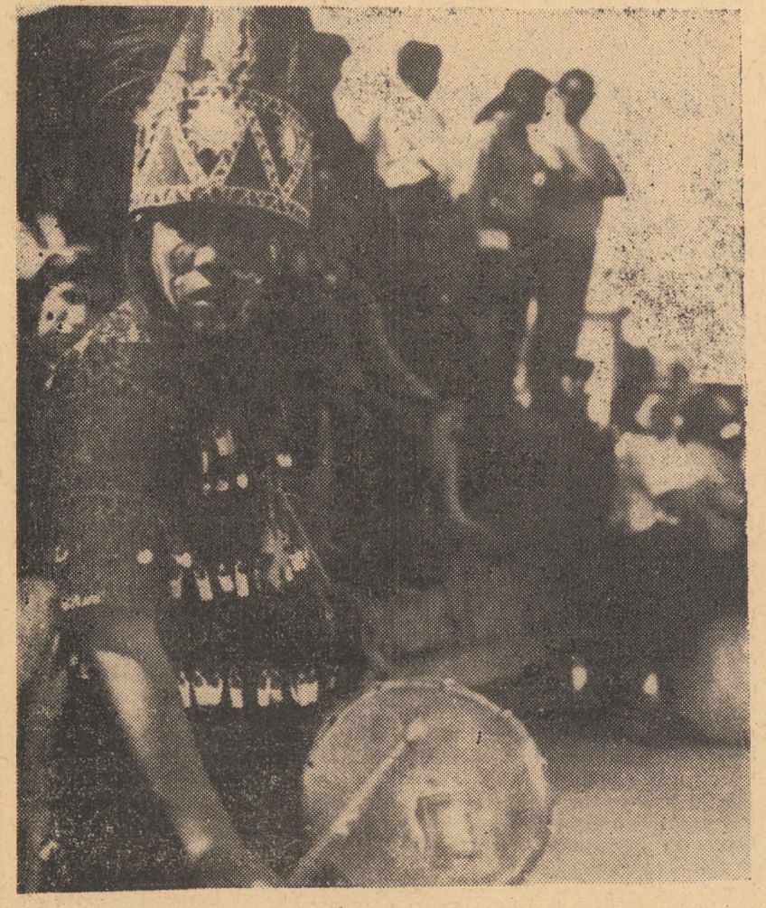
Tradiționala sărbătoare a indienilor mexicani de anul nou, aspect din piața principală a Guadalupei

devărat, convenția limita tonajul total al navelor de pescuit spaniole la 40 de tone, însă prevederea nu a fost respectată. Diferendul a devenit acut o dată cu extinderea de către Maroc a apelor sale teritoriale la 12 mile. Hotărîrea nu a fost luată în considerare de Spania care, la un moment dat, și-a mobilizat un număr de vase de război pentru protejarea navelor de pescuit aflate dincoace de această limită. După Conferința de la Geneva în problemele Dreptului Mării, guvernul marocan a cerut Madridului anularea convenției din 1860 și încheierea unor acorduri similare celor pe care Spania le-a semnat cu Franța, Irlanda și Marea Britanie. Ele prevedeau retragerea progresivă a navelor de pescuit spaniole din apele teritoriale ale țărilor respective, în