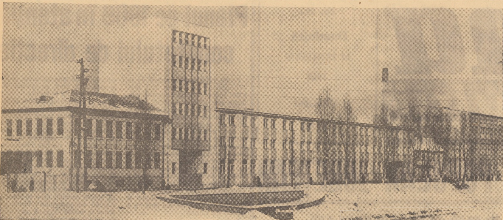
Panoramic industrial sibian