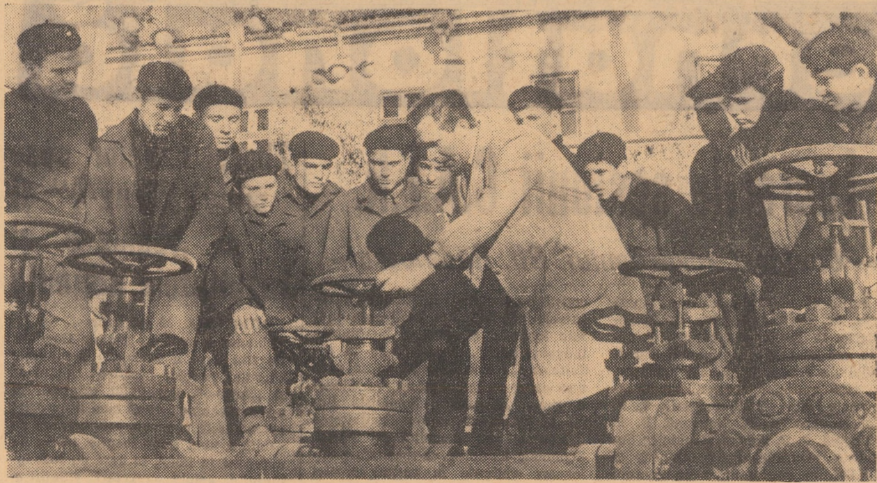
Aplicații practice privind manevrarea corectă a instalațiilor de suprafață la Grupul școlar petrol din Mediaș, anul II operatorii.