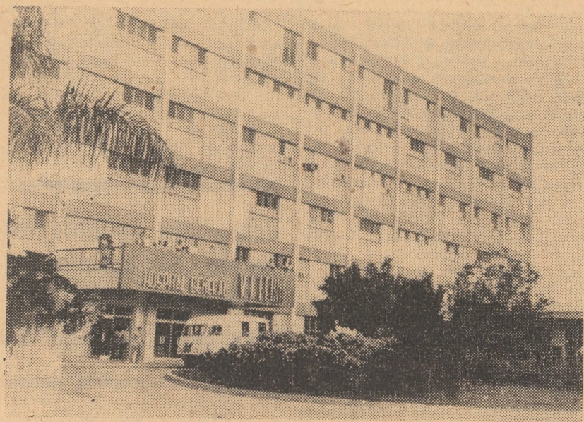
CUBA. Vedere exterioră a noului spital „Lenin” construit recent în orașul Olgin din provincia Oriente

Potrivit acordului de procedură, 80 de ziariști, fotoreporteri și operatori de televiziune — cite 12 desemnați de fiecare delegație și 32 aparținînd unor țări diferite decît celea ale participanților la conferință, desemnați de Ministrul de Externe al Franței — vor fi admisi în primele 15 minute să asiste la această ședință, pe care unii comentarii o denumesc încă de pe acum „istorică”.