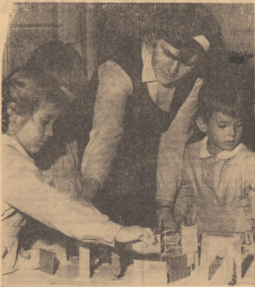
Orele de practică ale elevilor Liceului pedagogic din Sibiu se desfășoară într-un cadru instructiv și pasionant...

Rubrică redactată de N. MARIN cu sprijinul cititorilor