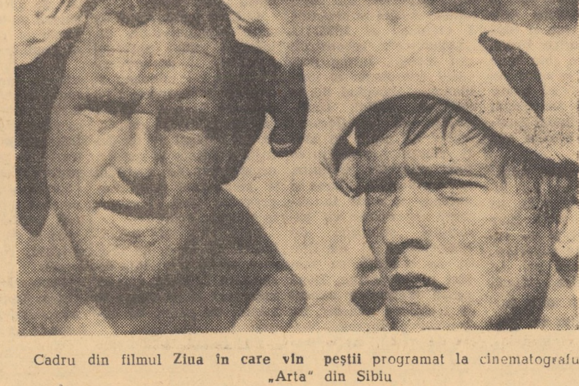
Cadru din filmul Ziua în care vin pestii programat la cinematograful „Arta” din Sibiu

13,30; 14,00; 14,35; 16,25; 17,30; 19,05; 23,45 (programul II).