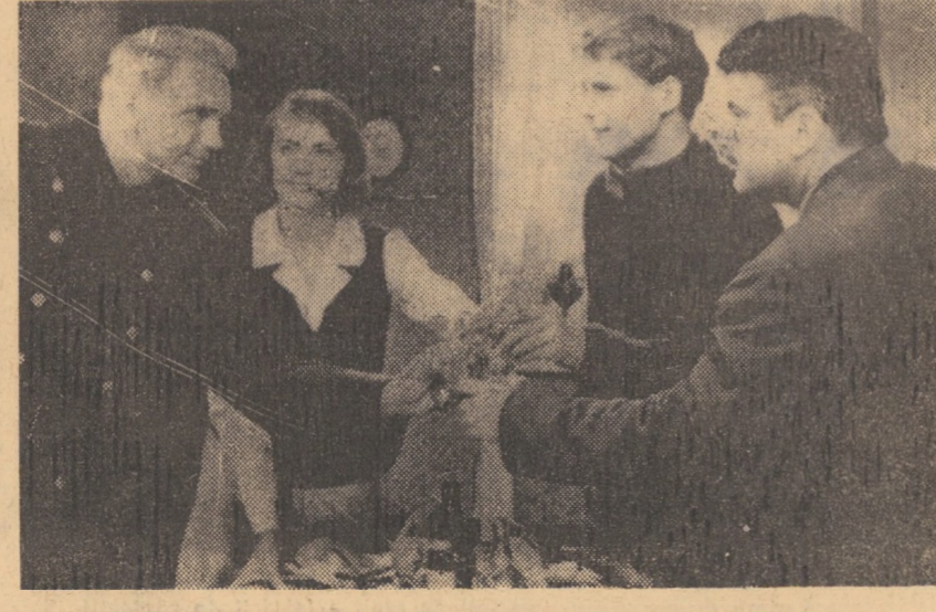
Cadru din filmul Suflete tari care rulează la cinematograful „Tineretului” din Mediaș