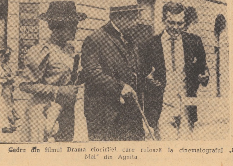
Gădru din filmul Drama ciocirlei, care rulează la cinematograful „8 Mai“ din Agnita

SIBIU: PACEA: Rio Bravo seriile I și II (orele 8,45; 11,15; 14,30; 17,30; 20,30); ARTA: Falstaff (orele 10,00; 12,00; 14,30; 16,30; 18,30; 20,30); TINERETULUI: Heroina (orele 10,00; 12,00; 14,30; 16,30; 18,30; 20,30); INDEPENDENȚA: Impușcături sub spânzurațoare (orele 11,00; 14,30; 16,30; 18,30; 20,30).