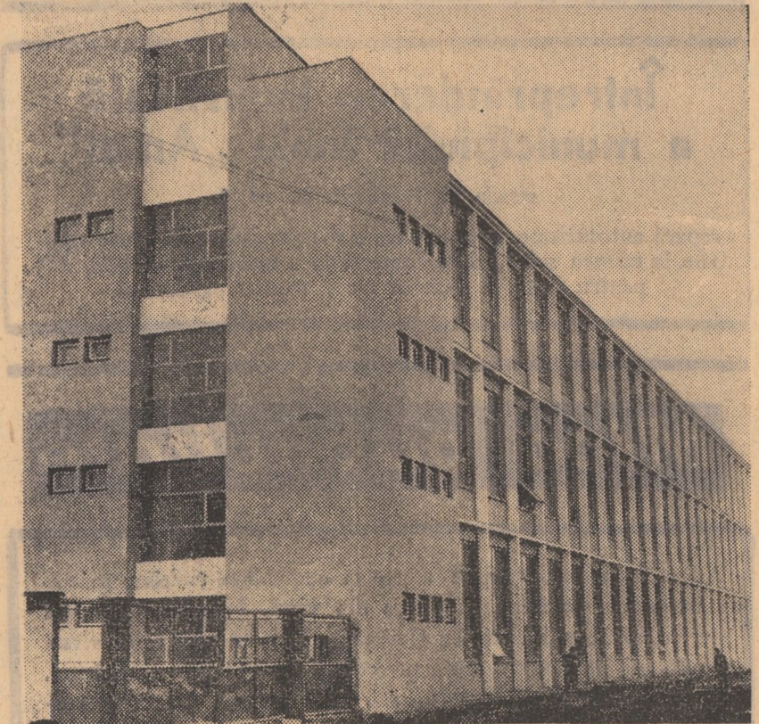
Spațioasa construcție a Centrului de finisaj „7 Noiembrie” din Sibiu

rea populației orașului și implicat a numărului de elevi. În actualul an școlar, la Cisnădie, în școlile generale, licee, la școala profesională și tehnică de maistri învățați un număr de 3804 elevi, cu 1305 mai mulți față de anul 1965.