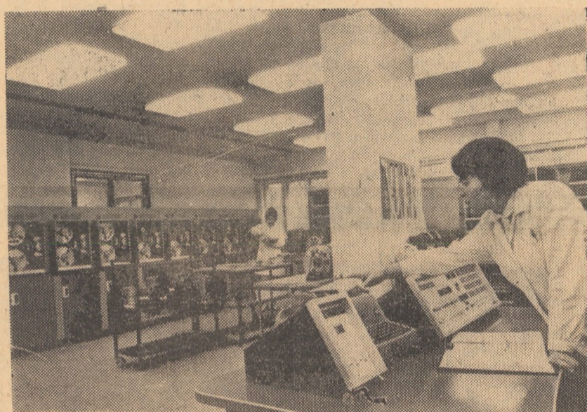
R.S. CEHOSLOVACĂ. Calculator de pensii. În Cehoslovacia pensile celor peste 2 milioane de pensionari de vîrstă au crescut. În acest caz trebuie recalculate cele peste 2 milioane de pensii, lucru ce ar necesita un timp de 12-15 luni. Calculatorul de pensii reduce acest timp la mai puțin de 4 săptămîni. În foto: operatorul pune în funcțiune calculatorul de la pupitrul de comandă

Agenda zile de vineri, în diferite localități, între care Dacca și Barisal, au avut loc noi demonstrații.