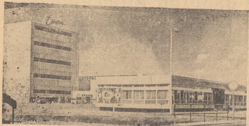
IRLANDA DE NORD. Fabrica de prelucrare a lutei din Londonderry.