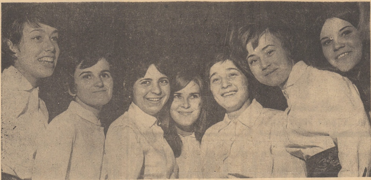
Grupul vocal al întreprinderii „7 Noiembrie” din Sibiu și-a propus să acompanieze soliștii vocali de muzică ușoară.

Agencia Sibiu a O.N.T., str. Nicolae Bălcescu nr. 53; Farmacia nr. 24, cu serviciul de noapte, str. Nicolae Bălcescu, nr. 49.