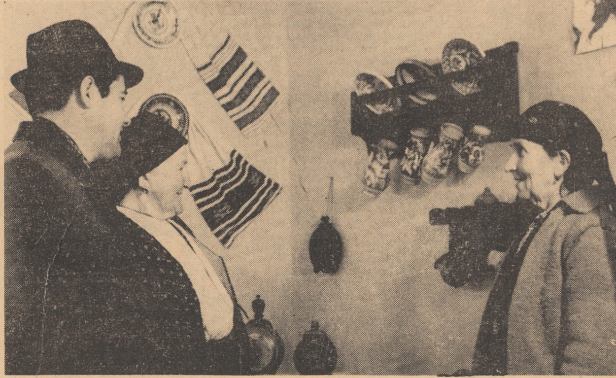
Aspect din una din sălile interesantului muzeu etnografic „Badea Cîrșan”, amenajat în comuna Cîrșoara.