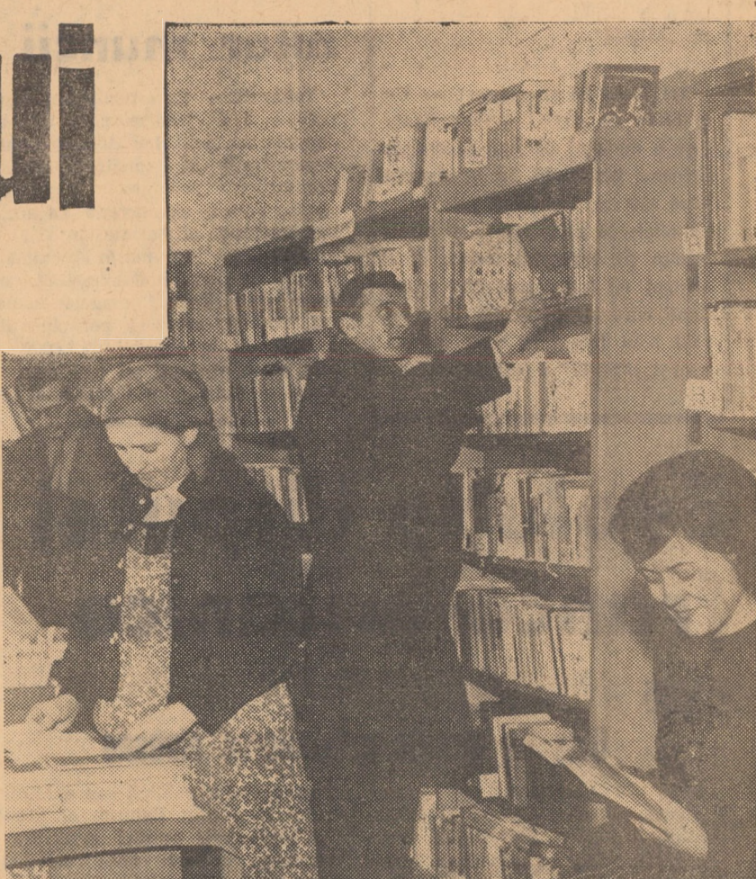
Aspect diurn dintr-o bibliotecă sătească

Continuînd și dezvoltînd și pe mai departe această frumoasă preocupare de valorificare a folclorului local în valorile sale specifice, răspundem unei chemări patriotice și cetățenești de importanță pentru viața noastră social-culturală.