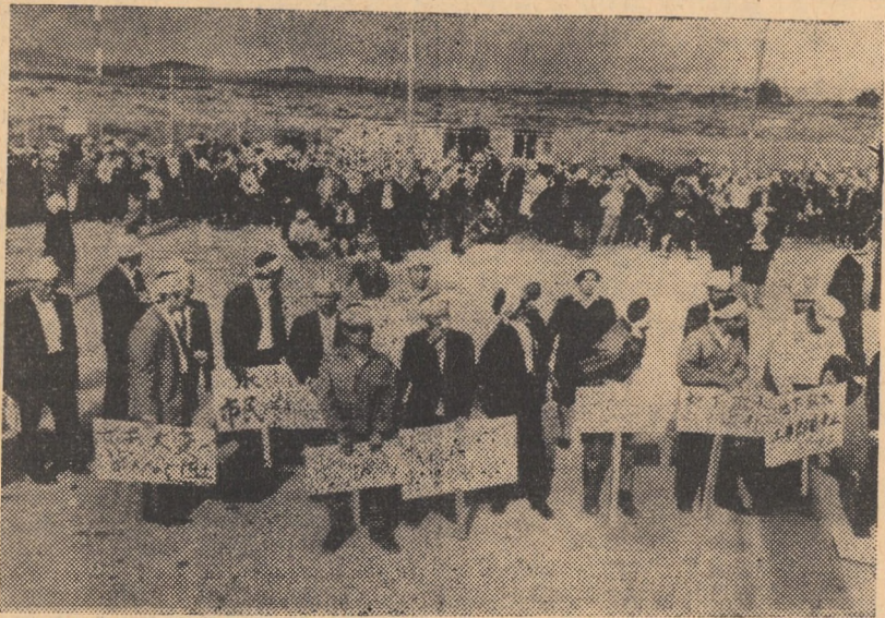
JAPONIA. — Aspect de la o recentă acțiune de protest, inițiată de cetățenii din Gushikawa, împotriva proiectului unei corporații americane de deviere a surselor de apă și pentru oprirea forțelor experimentale

Tel Aviv 24 (Agerpres). — Un purtător de cuvânt militar israelian a declarat că luni dimineață avioane israeliene au bombardat baze ale organizațiilor palestiniene aflate la El Hammeh și Maissaloun pe teritoriul sirian. El a afirmat că toate aparatele israeliene care au participat la acest raid s-au întors la bază, iar un aparat „Mig-17” a fost doborât.