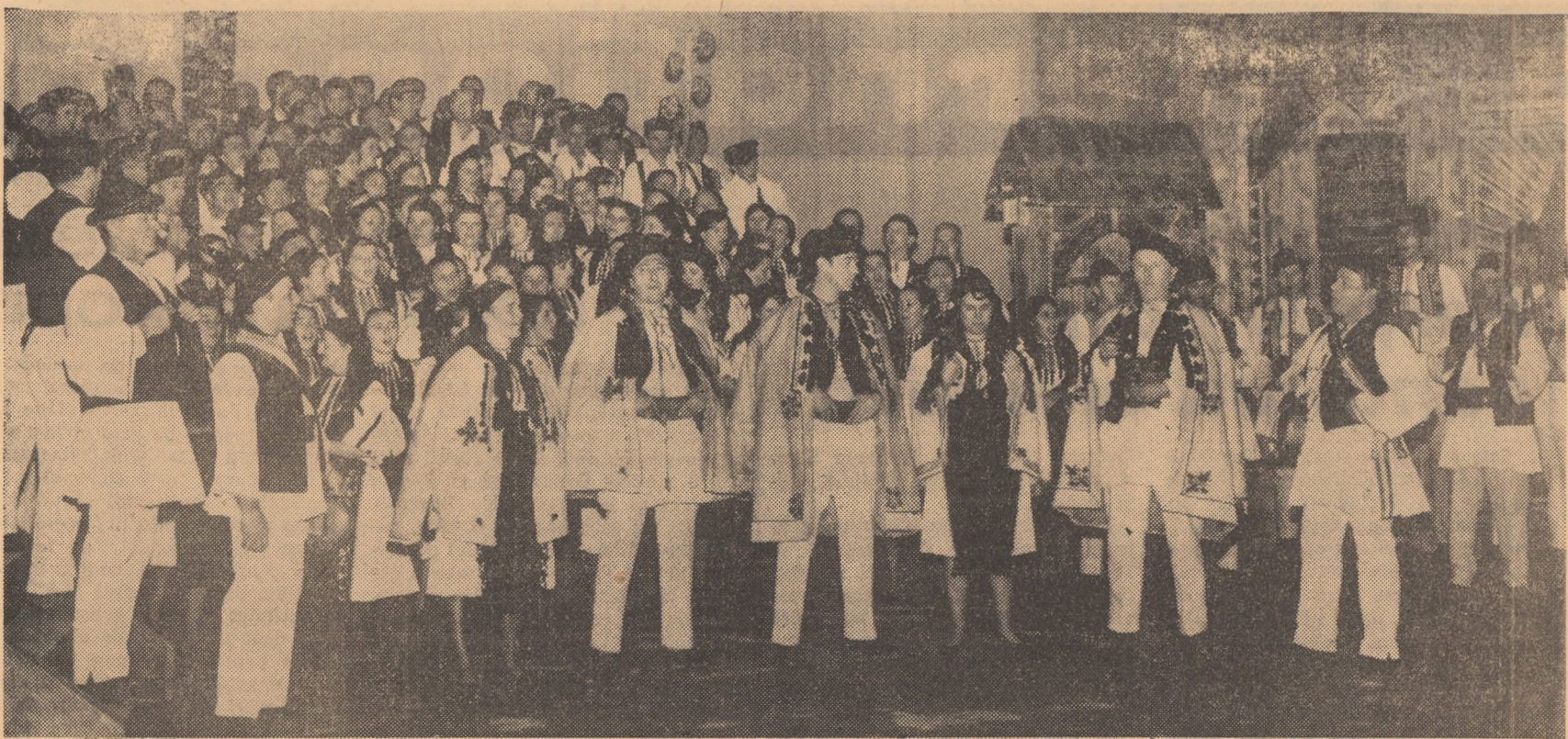
Scenă de ansamblu din spectacolul prezentat la televiziune, în cadrul popularei emisiuni „Dialog la distanță”, cu opera folclorică „Nunta cloabănească”.

În contextul avântului pe care viața socialistă îl imprimă în toate sectoarele de activitate, manifestările culturale cunosc o eferescență dinamică. O adevărată pasiune a noului a invadat conștiința locuitorilor comunelor și orașelor noastre, la confluența simbolică a tradițiilor înaintate cu spiritul creator al zilelor noastre.