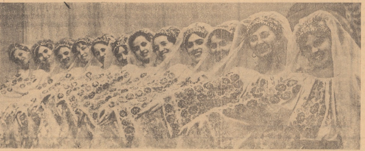
Grupul feminin al echipei de dansuri „Automecanica”

Afirmîndu-se din ce în ce mai puternic în peisajul spiritual al județului, filialele uniunilor de creație, au depus și ele în acești ani o contribuție inestimabilă la îmbogățirea patrimoniului artistic local. Compozitori și scriitori, artiști plastici și-au făcut meru simțit prezența în viața culturală locală, afirmîndu-se adesea prestigios pe plan național. În nenumărate expoziții deschise an de an, în repertoriul corurilor din județ, s-a simțit adesea o adîncă legătură cu creațiile fără seamăn ale folclorului, ceea ce a dat lucrărilor o vitalitate nouă, a înlesnit circulația fluxului emoțional și de idei conținut în ele, spre sufletele și mințile publicului beneficiar.