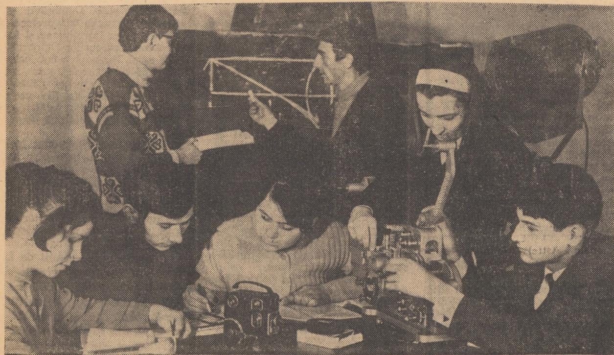
Oră de cultură și tehnică cinematografică în cadrul cîneclubului uzinei „Independența” din Sibiu.

Cumpăr Dacia 1100. Sibiu, telefon 11520, ora 7—14.