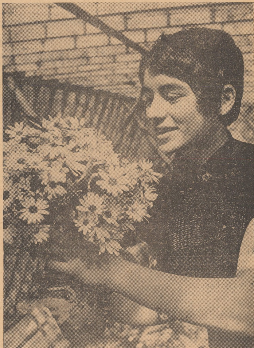
Încă discretă pe cimpuri, primăvara e permanentă în sere

Clubul va funcționa tot în incinta Casei de cultură a sindicatelor (în fiecare miercuri între orele 18—21).