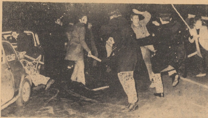
ITALIA: Ciocniri între poliția din Roma și participanții la o demonstrație împotriva războiului din Vietnam.

Saigon 14 (Agerpres). — Continuându-și acțiunile de atac și hărțuire, începând din delta fluviului Mekong până în regiunile septentrionale ale Vietnamului de Sud, forțele Frontului Național de Eliberare se găsesc în cea de-a 20-a zi de la declanșarea ofensivei lor generale împotriva obiectivelor militare americane și saigoneze. În noaptea de joi spre vineri, comandantul trupelor S.U.A. a făcut cunoscut că F.N.E. „a bombardat alte 15 obiective militare”. În nordul țării, o unitate a infanteriștilor marini americani a fost surprinsă printr-un atac cu grenade și arme automate și apoi încercuțată. Primind sprijinul unor unități de artilerie și al elicopterelor, militarii americani au reușit să spargă încercuțarea, dar cu prețul unor pierderi în oameni și materiale. În regiunea deltei Mekongului, patrioții ale saigonezilor aflate în apropierea localităților Tri Ton, Vi Thanh, Kien Thien, Long My și Ba Long.