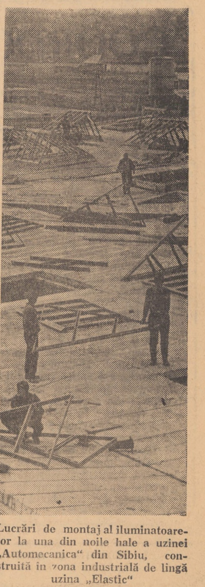
Lucrări de montaj al iluminatoarelor la una din noile hale a uzinei „Automecanica” din Sibiu, construită în zona industrială de lângă uzina „Elastic”

Hărnicia, priceperea, dragostea față de meseria aleasă, pasiunea și dăruirea pentru îndeplinirea sarcinilor de plan, pentru producerea de țesături cît mai multe, mai durabile și mai frumoase sînt coordonate pe care le-am întîlnit la toți din această uzină. Nu am ai amintit de aportul specialiștilor al inginerilor și tehnicienilor, al celor care sînt meru în căutarea de noi soluții și procedee de fabricație, de pasiunea lor pentru ca Zina, Cecilia, Gherghina, catifeaua, să devină într-adevăr ambasadorii muncii lor peste hotarele țării în Anglia, R.F.G., Liban etc. E. SANDU