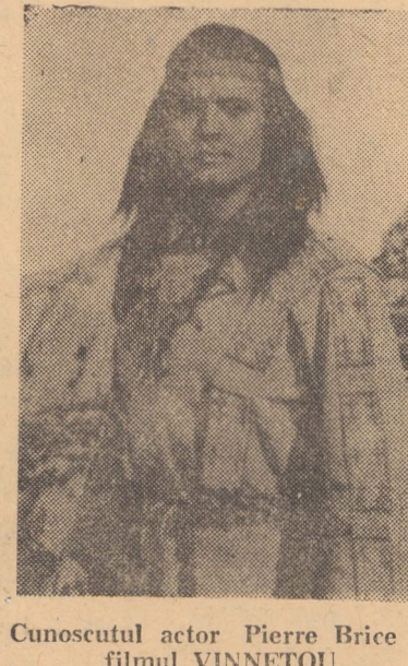
Cunoscutul actor Pierre Brice în filmul VINNETOU.