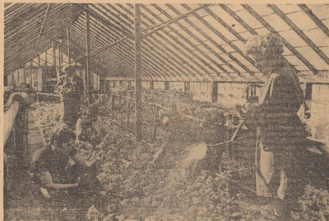
În sera I.C.S., secția spații verzi, sînt pregătite anul acesta 570.000 buc. răsăduri de țori, destinate ornamentalării spațiilor verzi din municipiul Sibiu, cu 100.000 muncă din seră.

(Continuare în pag. a II-a) GH. GRĂDINARU