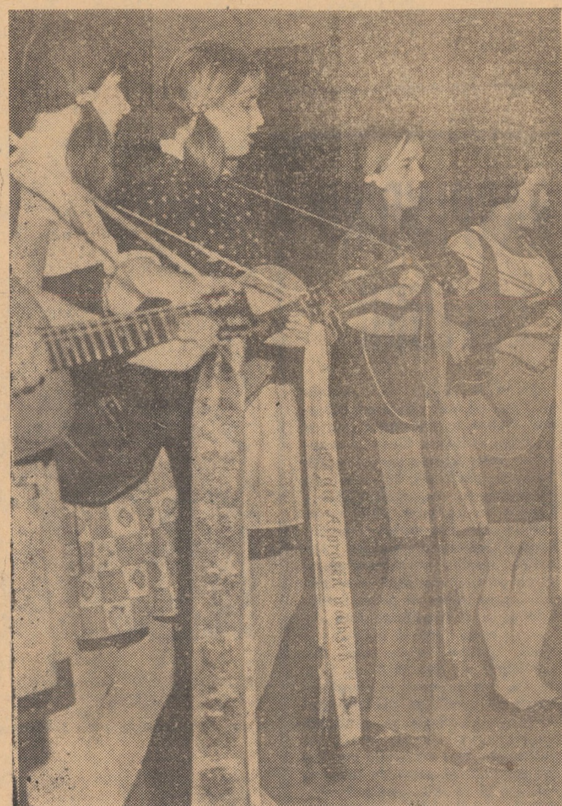
Formația de chitare a Liceului teoretic nr. 2 din Sibiu, în timpul programului prezentat în cadrul Festivalului cultural-artistic de primăvară, în sala clubului uzinei „Independența” Sibiu