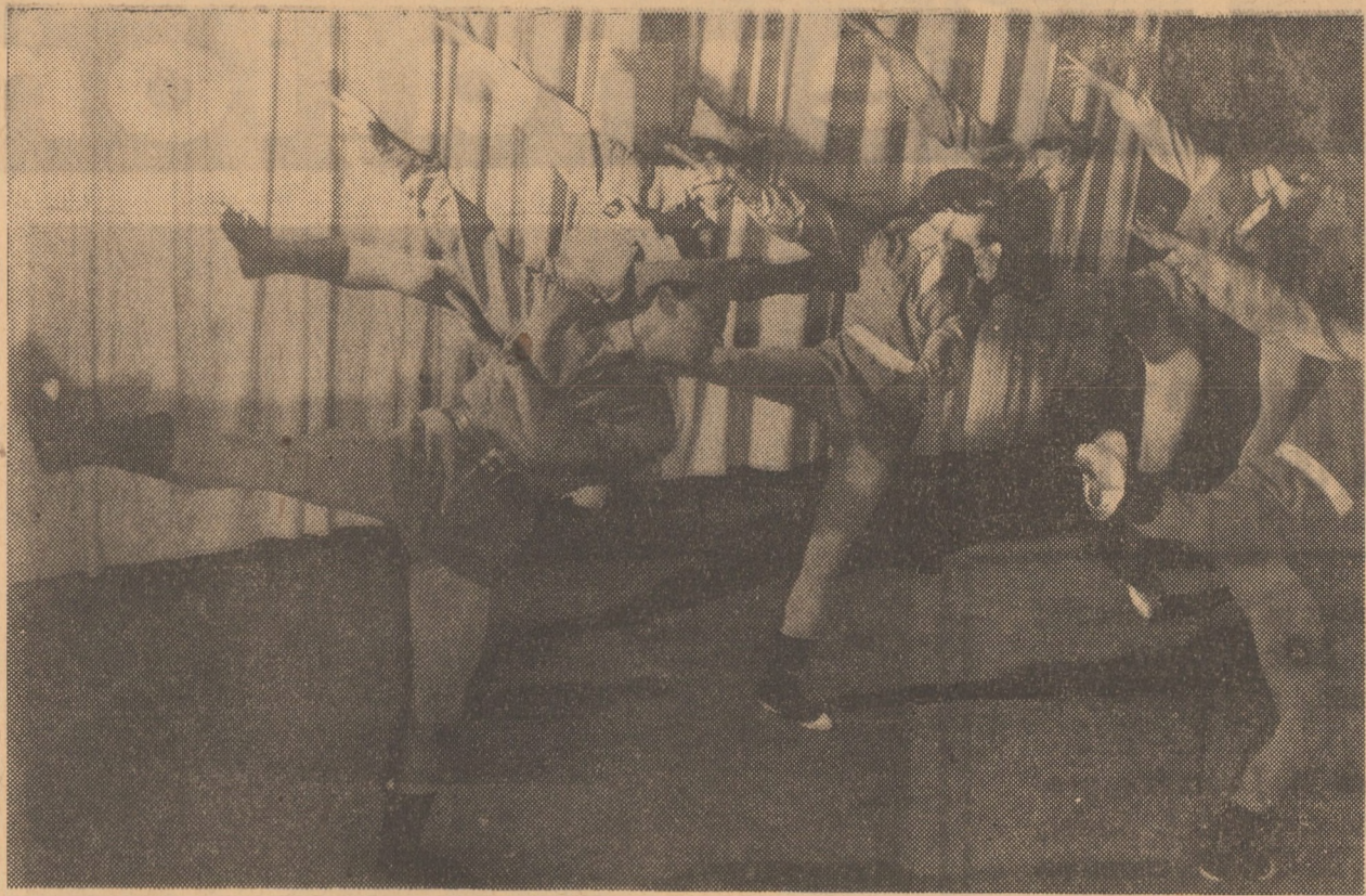
Scenă din spectacolul Ansamblului artistic al armatei din Bratislava, susținut aseră la Sibiu. Ultimul spectacol, în această seară, în sala Teatrului de stat