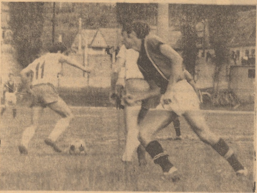
Fază din partida Gaz metan — C.S.M. Sibiu.

Repriza secundă nu reține atenția nici prin faze dinamice și cu atât mai puțin prin mulțimea ocaziilor de gol. Cu toate acestea, unicul gol al partidei se înscrie când nimeni nu se mai aștepta, dintr-o fază fixă — la un corner — și cu lar-