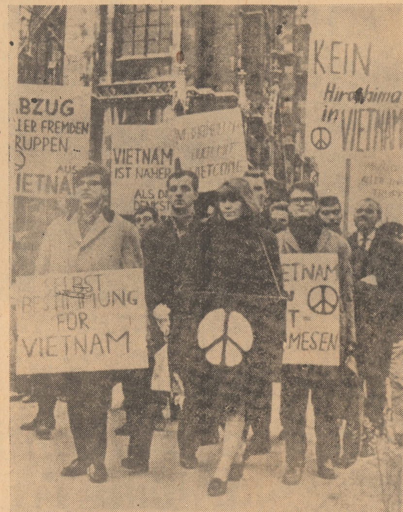
R.F.G. Muncitori și studenți din Aalen demonstrând împotriva continuării războiului dus de către S.U.A. în Vietnam

Cauza dreaptă a poporului vietnamez va învinge! Moscova, 10 iunie 1969.