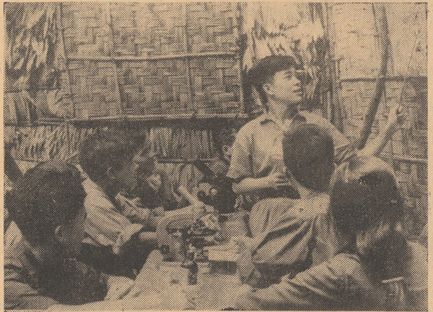
VIETNAMUL DE SUD. În diferite zone eliberate din Vietnamul de Sud s-au deschis cursuri la colegii medicale. O oră de curs într-o cabană improvizată

La ședința de seară, prezidată de Todor Jivkov, prim-secretar al C.C. al P.G. Bulgar, au luat cuvântul: Alvaro Cunhal, secretar general al C.C. al P.C. din Portugalia, Gustav Husak, prim-secretar al C.C. al P.C. din Cehoslovacia, Jorge del Prado, secretar general al C.C. al P.C. din Peru.