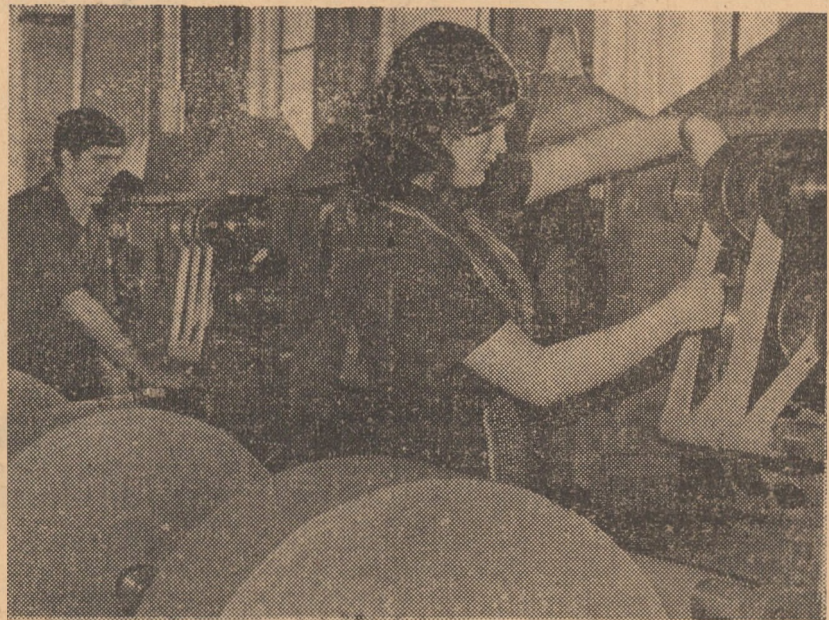
Într-una din secțiile întreprinderii de industrie locală Agnita, se produce hîrtie gumată, folosită în fabricarea mobilei pentru lipirea furnirului

maistrul sculer la uzina „Emailul roșu” Mediaș