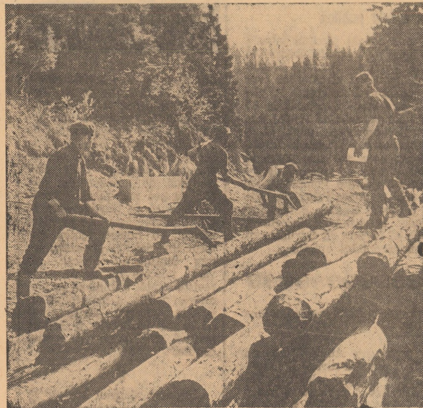
Un domeniu de activitate în care ochiul cetățeanului pătrunde extrem de rar. Fotoreporterul ziarului nostru a urcat „la munte” pentru a vă oferi imaginea secerării din munca tăparilor din pârchețele de exploatare I.F. din Valea Căminului