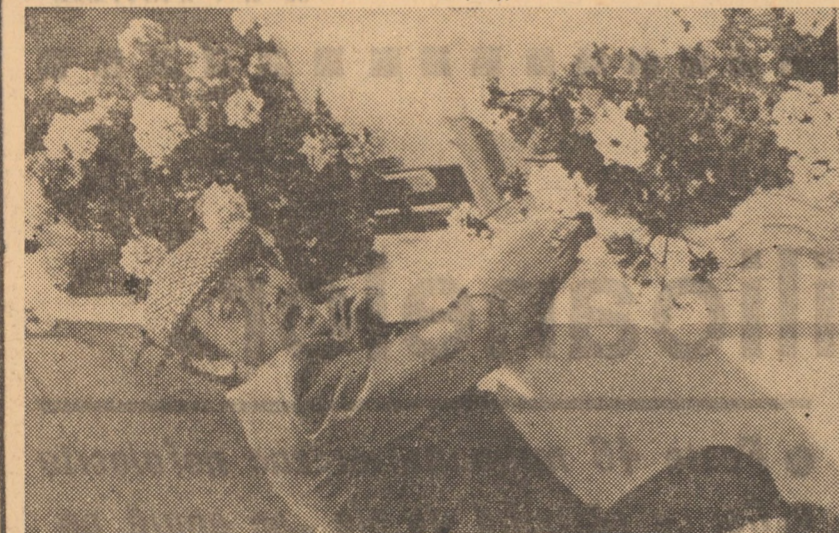
Doctorul Philippe Leroy în filmul Noaptea e făcut pentru... a visa

SIBIU: PACEA: A trăi pentru a trăi (orele 10,00; 13,00; 16,30; 20,00); ARTA: Eclipsa (orele 9,00; 11,30; 13,45; 16,00; 18,30; 20,45); TINERETULUI: Tată de familie