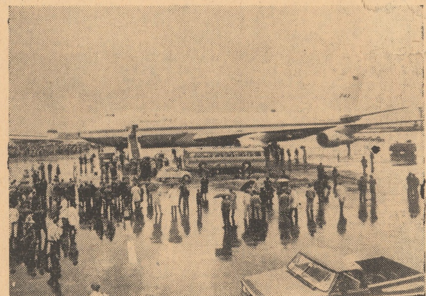
FRANȚA. Avionul american gigant „Boeing 747” care poate transporta 490 pasageri, este expus la Salonul Internațional de la Bourget. Pentru a i se scoate în evidență mărimea a fost așezat alături de un autobuz. La stînga se vede „Concorde 001”

● Epidemia de holeră continuă să facă ravagii în regiunea de nord-est a Tailandei. Potrivit ultimelor știri transmise din Bangkok, pînă în prezent s-au îmbolnăvit de holeră peste 500 de persoane.