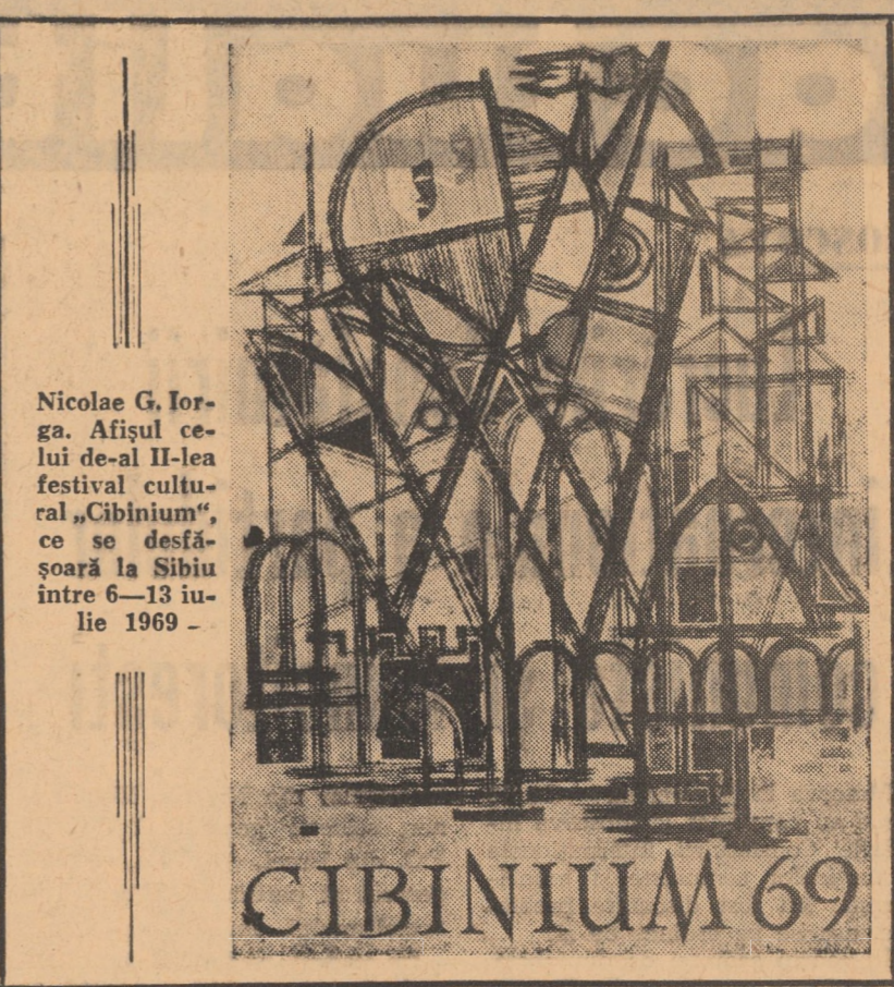
Nicolae G. Iorga. Afisul celui de-al II-lea festival cultural „Cibinium”, ce se desfășoară la Sibiu între 6—13 iulie 1969 —

Conf. univ. ENEA BORZA Conservatorul „G. Dima” Cluj