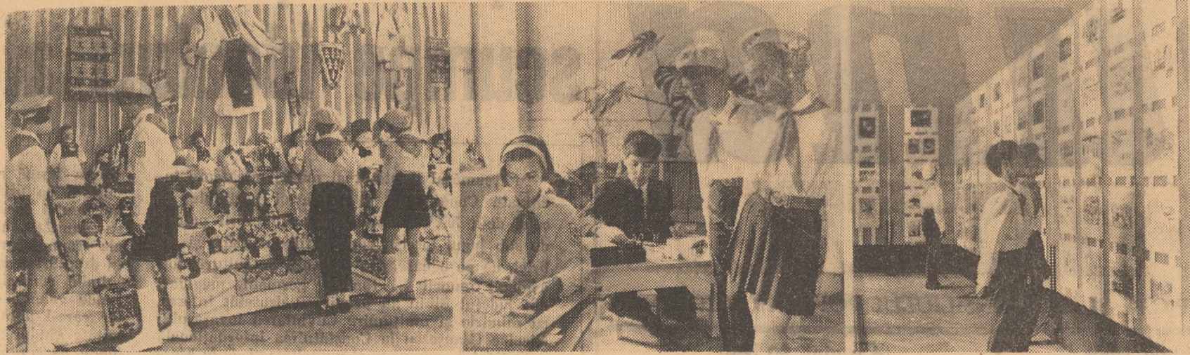
Deschisă joi la prinz în localul Grădiniței nr. 1 din Sibiu (str. Arhivelor), Expoziția jubiliară a organizației pionierilor a atras deja numeroși vizitatori.