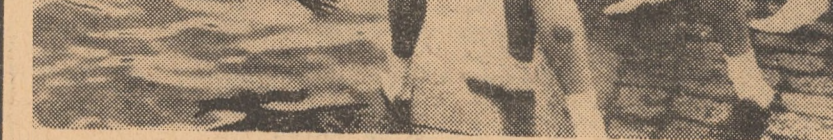
R.S. CEHOSLOVACA. Aspect din timpul desfășurării tradiționalei festive pragheze

Referindu-se la dificultățile politice interne ale Administrației, revista consideră că următoarele luni ar putea fi cruciale. „Ceea ce se va întimpla pînă la sfîrșitul verii va arăta dacă inflația va putea fi stăvilită fără a provoca o criză”, conchide săptămînalul.