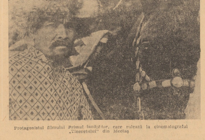
Protagonistul filmului Primul înălțător, care rulează la cinematograful „Tineretului“ din Mediaș