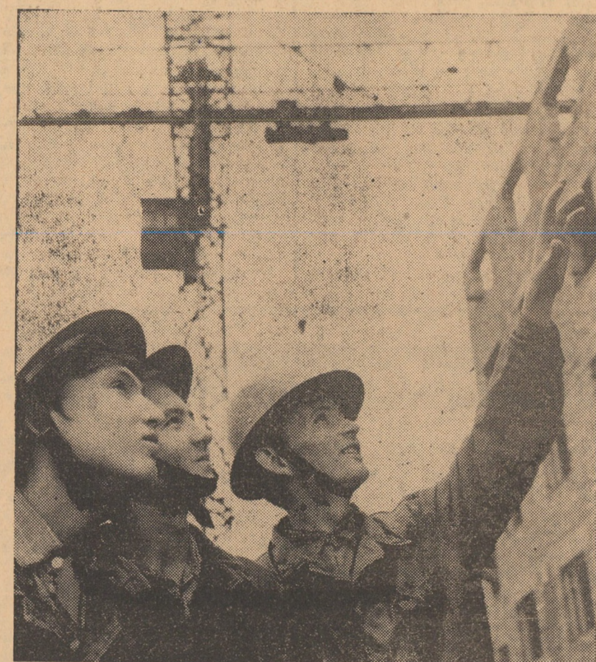
Pe șantierul muncii voluntar-patriotice de pe strada Țiglarilor, tinerii din mai multe școli ale Sibiului au hotărît să-și aducă o importantă contribuție

Să ridicăm tot mai sus steagul leninismului în lupta pentru realizarea revoluționară a lumii! Trăiască leninismul!