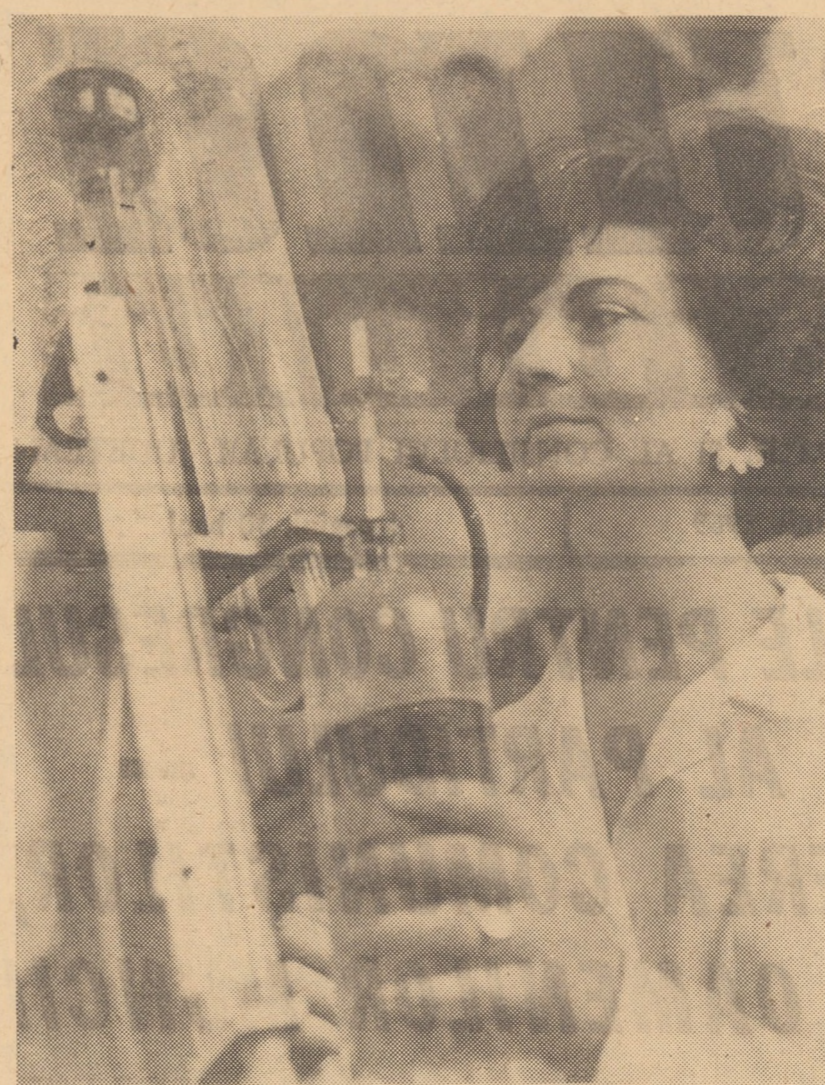
Laboratorul fizico-chimic al uzinei „Independența”. Se determină conținutul de carbon al fontei și al oțelurilor.

Entuziasta adunare a comiștilor din Moșna a fost o manifestare puternică, înflăcărată a atașamentului fierbinte față de partidul nostru, față de ideile profund științifice cuprinse în documentele pregătitoare pentru Congresul al X-lea al partidului.