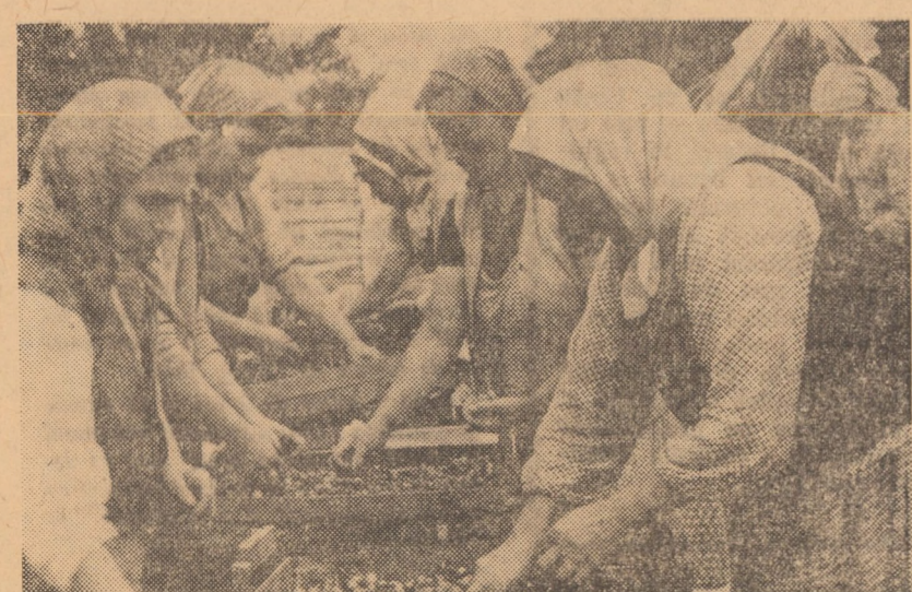
După cules, sortatul și apoi vișinele populează piețele