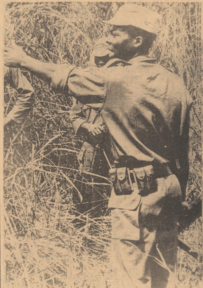
Un comandant al F.N.L. angolez dînd ordine în vederea unui atac în regiunea Cabinda