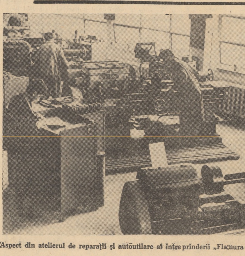
Aspect din atelierul de reparații și autoutilare al întreprinderii „Flamura roșie” Sibiu, recent dat în folosință

Este cunoscut, tovarăși, că în munca noastră — și nu mă refer numai la Maramureș, la Baia Mare, ci în general în activitatea noastră — au existat în acești ani și lipsuri. Am avut de învins multe greutăți, dar trebuie să subliniez că partidul, întregul popor au știut să acționeze pentru învingerea și depășirea acestor greutăți. Știm că mai avem mult de făcut pentru a realiza societatea socialistă multilateral dezvoltată, care să asigure condiții materiale și spirituale deosebite pentru oamenii muncii, să creeze un cadru