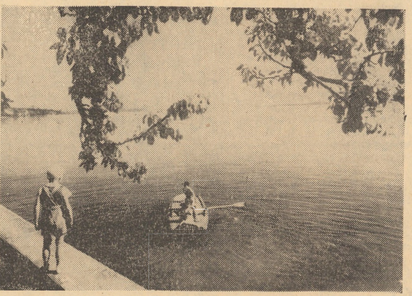
ELVEȚIA. Vedere a unei părți din Lacul Constanța, colț plin de farmec și liniște