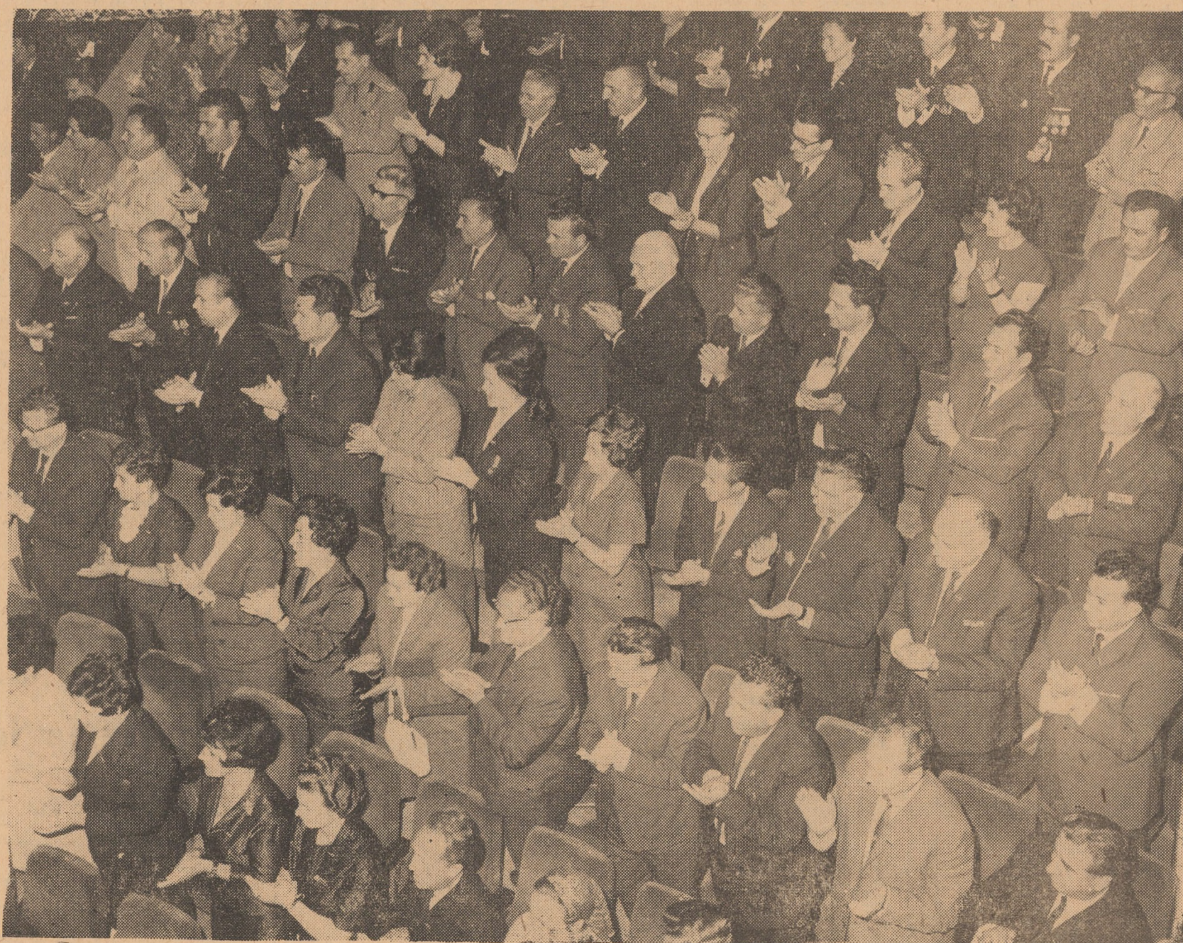
Aplauze și urale pentru documentele Congresului

Au urcat, de asemenea, la tribuna reprezentanții partidului comunist și muncitorești, socialiste, democratice, antiimperialiste, care