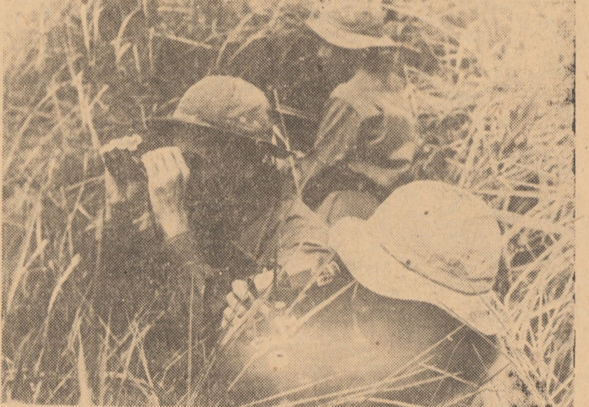
Vietnamul de Sud. Patrioți sud-vietnamezi în timpul unui atac asupra pozițiilor inamice la nord de Quang Tri

Forțele patriotice sud-vietnameze au bombardat importante obiective strategice americano-saigoneze în provincia Kien Hoa, în delta fluviului Mekong, la aproximativ 70 de kilometri sud de Saigon. În același timp, parașuțiști sud-vietnamezi au deschis foc de mortier asupra stației de radio Ban Me Thuot, situată în regiunea zonei platurilor înalte. Totodată, după cum a comunicat comandamentul S.U.A. de la Saigon, avioane de tip „B-52” au efectuat cinci misiuni de bombardament în zorii zilei de duminică în mai multe regiuni sud-vietnameze.