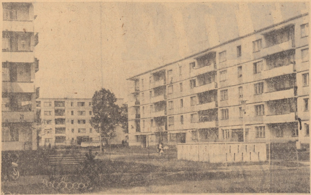
Din noul peisaj al cartierelor sibiene: Hipodrom

În aceeași măsură, redacția or-ganului Comitetului județean de partid Sibiu se angajează cu în-tregul crez, cu toată hotărîrea minții și a sufletului oamenilor, de a face și în continuare eforturi pentru ca, pe aria în care e aștepta-tă cu drag, „Tribuna” noastră să lucreze necontenit spre a da con-ținut și înțeles îndemnurilor pe care ni-le-a făcut partidul, acelea de a fi totdeauna în rîndul luptătorilor pentru progres, pentru ceea ce e nou și înaintat, militanți activi pentru informarea și formarea o-pinii publice înaintate.