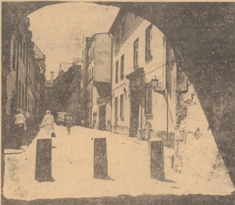
U.R.S.S. Vedere din partea veche a orașului Riga; fiecare clădire este o piesă de muzeu

procesul de centralizare administrativă excesivă și a trece la o descentralizare treptată în virtutea căreia autoritățile locale urmează să-și asume în viitor întreaga răspundere în domeniul asigurărilor sociale. Se prevede, astfel, ca pînă la sfîrșitul deceniului viitor, organele locale să fie în măsură să-și asume întreaga responsabilitate financiară și administrativă în domeniul asigurărilor sociale.