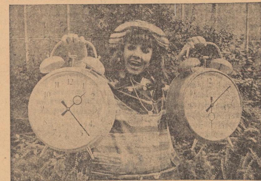
R.F. A GERMANIEI. Două ceasuri deșteptătoare cu două clopote să trezească din somn și un „mort”...