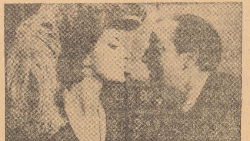
scenă din filmul „În umbra coltului”, care rulează la cinematograful Tineretului din Sibiu

CISNĂDIE: POPULAR: Cășătorie pipită (orele 11,00; 14,00; 16,00; 18,00 și 20,00).