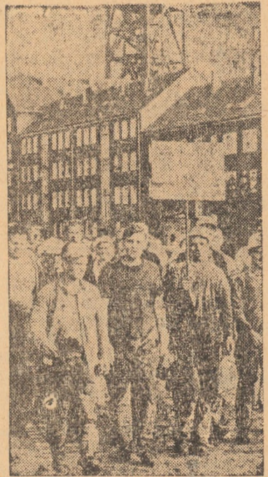
R.F. A GERMANIEI: O demonstrație a muncitorilor din Dortmund, pentru ieșirea din N.A.T.O. și condiții mai bune de muncă și salariizare

Pentru 28 septembrie, sindicatele feroviarilor din Sicilia au anunțat o grevă de 24 ore, ca urmare a întreruperii negocierilor între administrație și reprezentanții salariaților în problema programului de lucru.