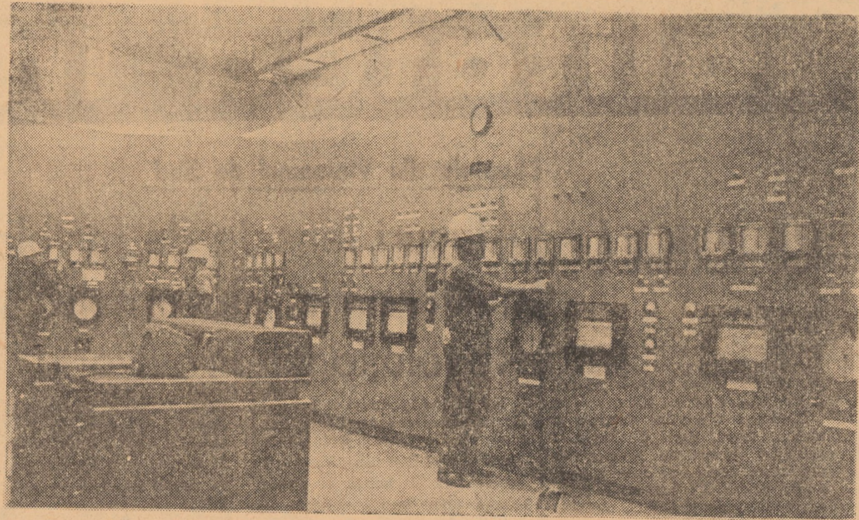
Interior din sala tabloului de comandă a Uzinei chimico-metalurgică din Coșca Mică