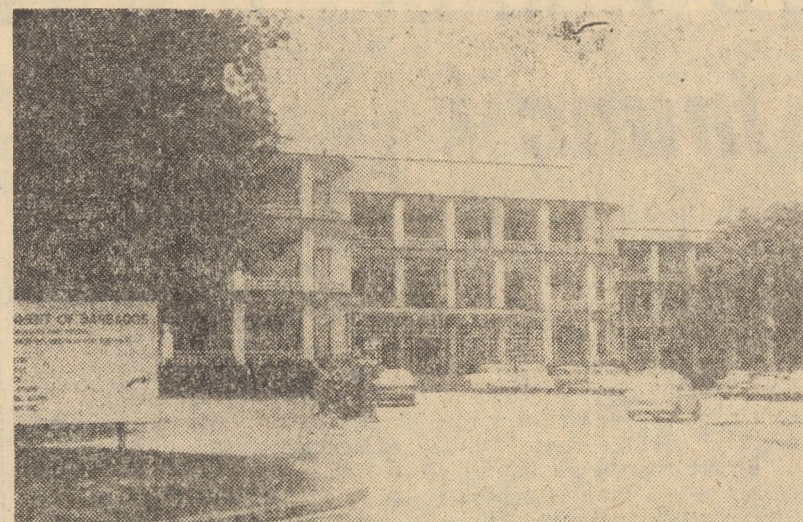
INSULA BARBADOS. Insula Barbados din Antilele Mici, mult timp sub dominația britanică, a obținut independența ca membră a Commonwealthului britanic în 1966. Palatul guvernamental din Bridgetown, capitala insulei cu aprox. 70.000 locuitori

Paris 27. — Corespondentul Agerpres, Georges Dascal, transmite: Secretarul general al Partidului Socialist Unificat, Michel Rocard, care a fost sprijinit de toate forțele de stînga, a cîștigat duminică mandatul de deputat în circumscripția Yvelines, din apro-