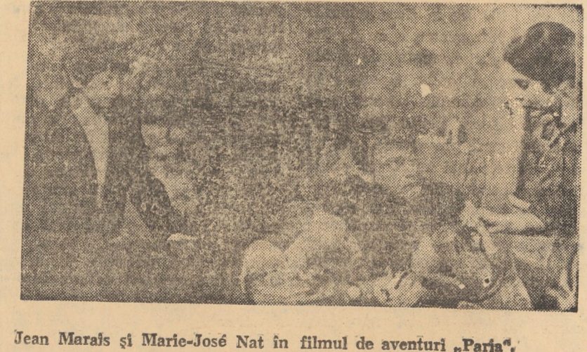
Jean Marais și Marie-José Nat în filmul de aventuri „Paria”