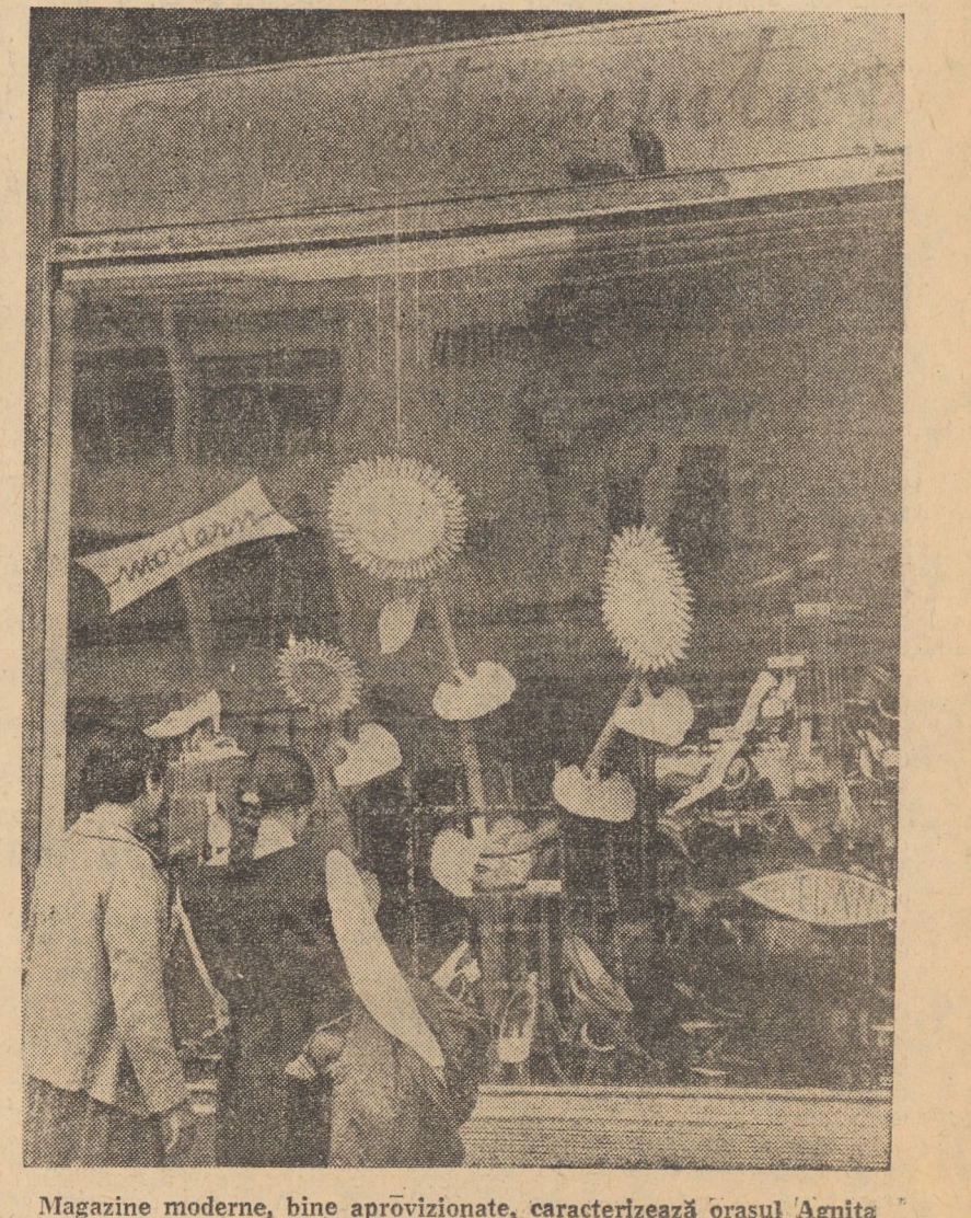
Magazine moderne, bine aprovizionate, caracterizează orașul Agnita

(Continuare în pag. a III-a) Interviu realizat de GH. GRADINARU