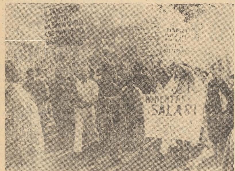
ITALIA. De câteva săptămâni masele populare din Italia și intensifică lupta pentru obținerea revendicărilor lor pe plan social și economic. Valul de greve și manifestații a cuprins întreaga Italie. O manifestație pentru mărirea salariilor la Milano

Semnalul de luptă împotriva tratatului de securitate dintre S.U.A. și Japonia, de solidaritate cu poporul vietnamez, pentru retrocedarea urgentă a Okinawei, s-a făcut astfel auzit în întreg arhipelagul nipon.