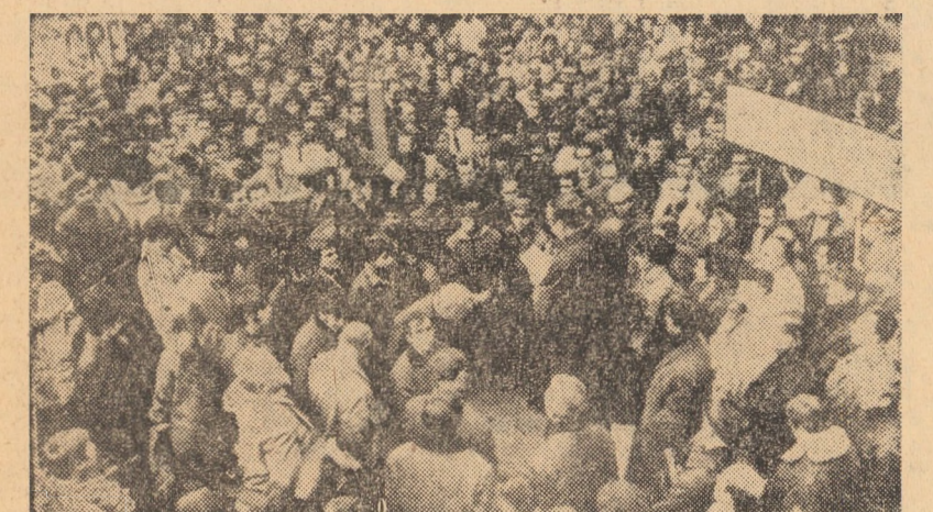
BELGIA. Un miting al muncitorilor de la uzinele Citröen din Forest

saigoneze împotriva teritoriului cambodgian au continuat. El a menționat că bombardarea de către avioanele „B-52” a satului Dak Dam, în zilele de 16 și 18 noiembrie, a provocat moartea a 25 de civili și rănierea a altor 8. „Cartea Albă” precizează că, între anii 1962 și 1969, teritoriul Cambodgiei a fost violat de 1.868 de ori pe uscat, de 165 de ori pe mare și de 5.149 ori în aer. Guvernul Cambodgiei cere, în încheiere, ca S.U.A. și regimul saigonez să pună capăt acestui „val de exterminări” a populației țării sale.