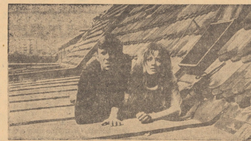
Actorii Jana Brejchová și Jaromir Hanzlik în filmul Maraton

glonte pentru general (orele 11,00; 14,00; 16,00; 18,00 și 20,00). DUMBRĂVENI: 7 NOIEMBRIE: Satul plutitor (orele 18,00 și 20,00). BAZNA-BĂI: Prințesa tristă (orele 17,00 și 19,00). OCNA SIBULUI: Pipele (orele 17,00 și 19,00). APOLDU DE SUS: 23 AUGUST: Crimă în stil personal (orele 17,00 și 19,00).