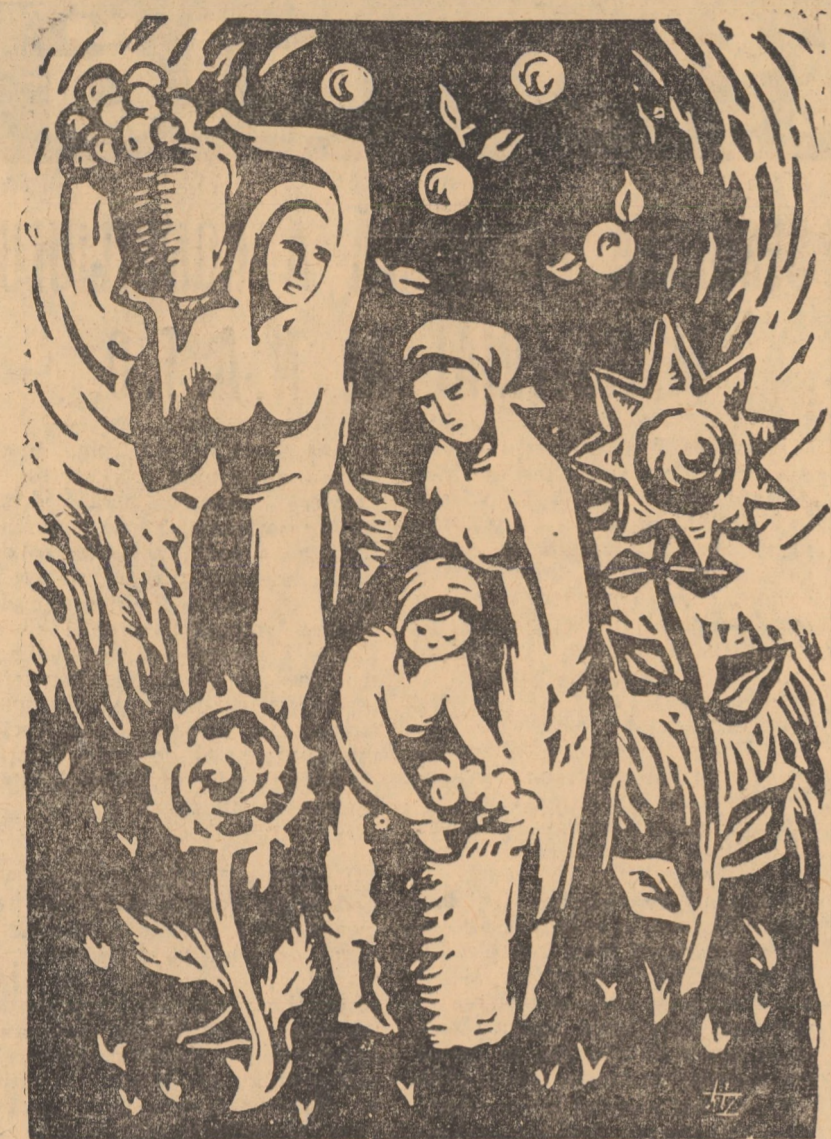
HORST ZAY RECOLTA