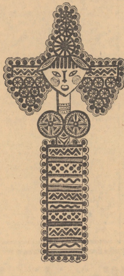
TROIȚA — EUGEN CIOANCA