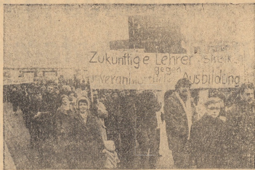
R.F. A GERMANIEI. Peste 3000 de studenți de la Colegiul pedagogic din Hanover și de la alte 8 colegii situate în vecinătatea orașului au demonstrat pe străzi pentru reducerea cheltuielilor militare în favoarea învățămîntului modern

Avioane americane de tip „B-52D” au continuat noaptea trecută bombardamentele asupra unor regiuni din provincia Quan Tri.