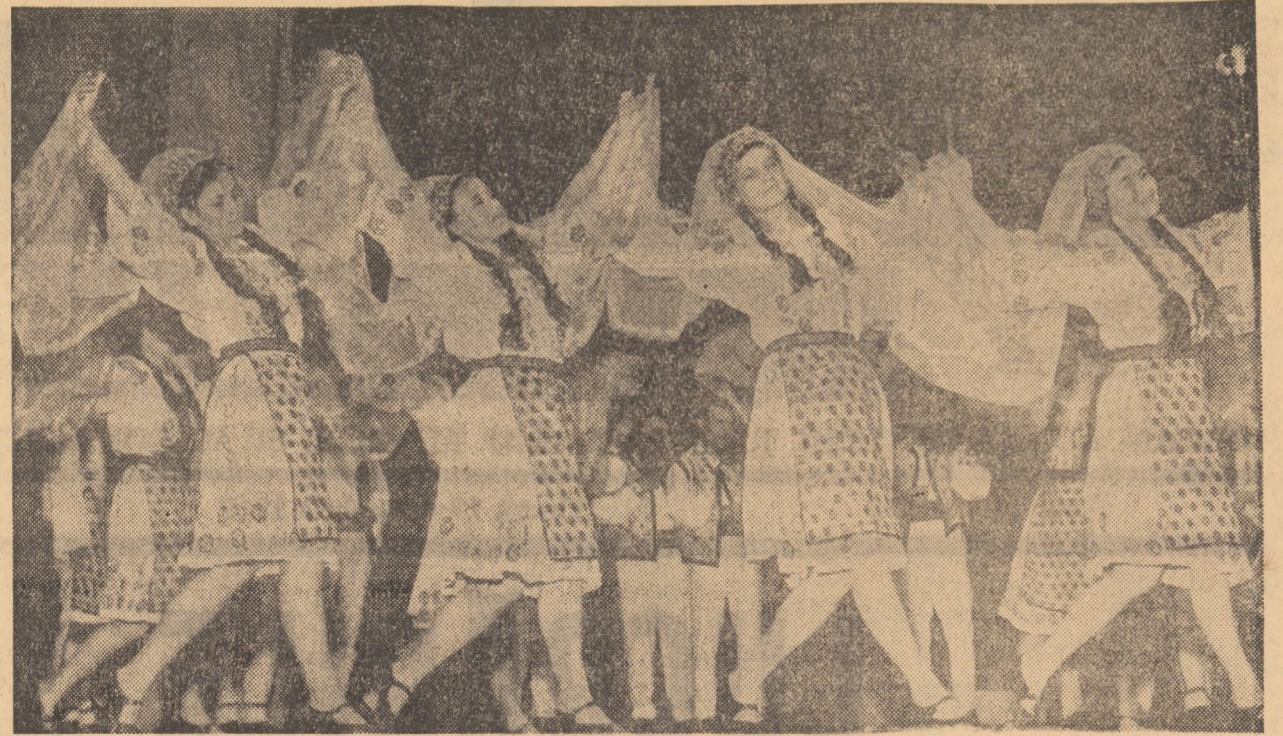
În fotografie: Un grup de dansatoare de la „Automecanica”, într-un spectacol public

Astfel, miercuri seara, pe scena clubului „Independența”, ei au dansat cu exuberanță lor bine cunoscută, pentru frunțașii în producție ai Uzinei de piese auto Sibiu.