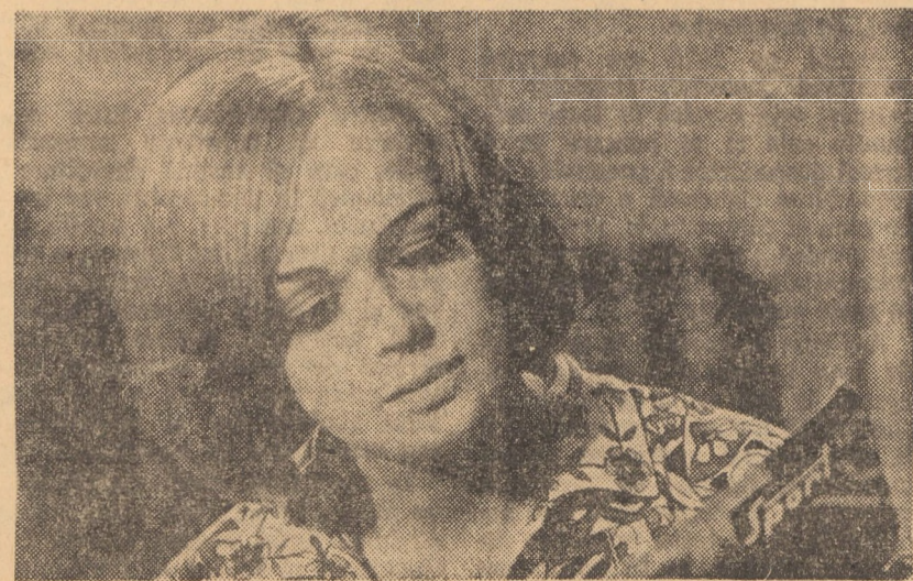
Protagonista filmului „Căsătorie pripită”, care rulează la cinematograful din Bazna-Băi

BAZNA-BAI: Căsătorie pripită (orele 17,00 și 19,00).