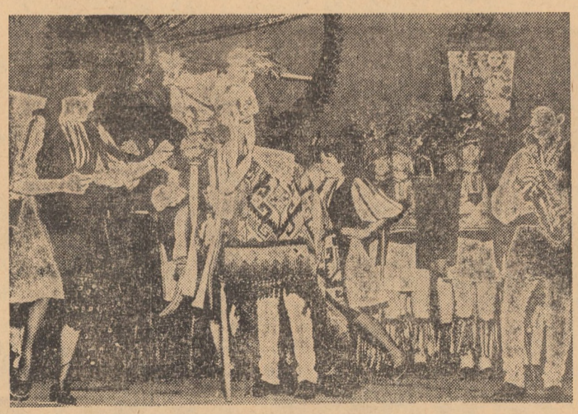
Sevență finală din spectacolul „Obiceiuri populare de Anul Nou”, prezentat luni seara pe scena Teatrului de stat din Sibiu