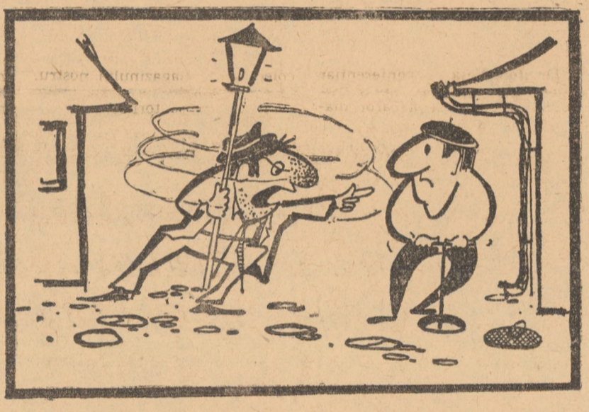
— Hei, omule, nu mai învîrți pămîntul!