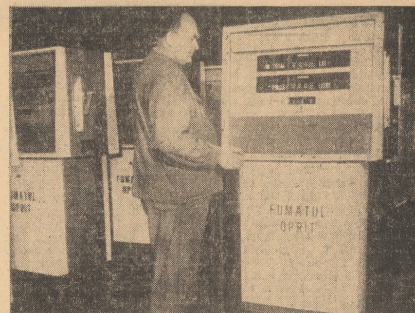
R.S. CEHOSLOVACA. La întreprinderea Adamov de lângă Brno, sudul Moraviei, se produc pompe de benzină. În fotografie: Un stoc de asemenea pompe destinate exportului în România

Proiectul de rezoluție lansează un apel țărilor angajate în conflictul din Orientul Apropiat pentru restabilirea încetării focului, punînd astfel capăt unei periculoase escaladări a conflictului. Apelul este lansat atît țărilor interesate cit și Națiunilor Unite pentru a face tot ce le stă în putință în vederea atingerii la o reglementare pașnică a crizei din această parte a lumii.