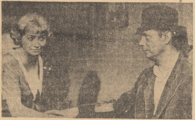
Cadru din filmul „Singurătate în doi”

Vremea va fi relativ frumoasă, dar răcoasă, cu cerul mai mult senin la început și apoi schimbător. Spre sfîrșitul intervalului vor cădea, cu totul izolat, averse slabe