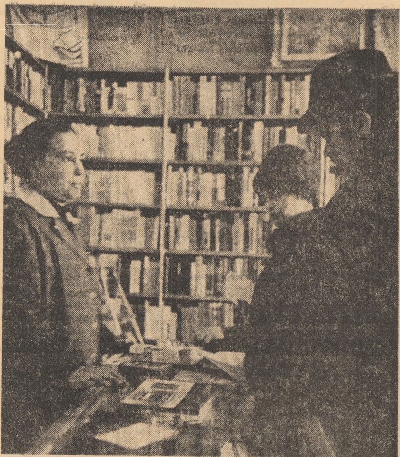
Zilnic, bibliotecă din centrul municipiului Mediaș este vizitată de un însemnat număr de cititori