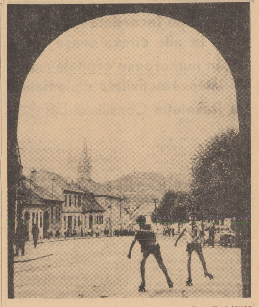
Secvență clădina medieșană

UN BĂRBAT trece pe stradă pe lângă doi cîini: — Il cunosții? — Întreabă unul din ei. — Da, este veterinarul meu.