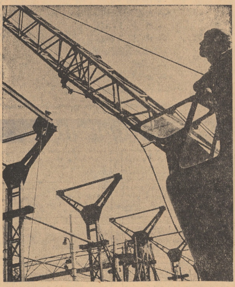
Sectorul fabricate Orlat. Se construiește o hală nouă

Plenara Consiliului Central al U. G. S. R. În zilele de 17 și 18 septembrie a.c. a avut loc Plenara Consiliului Central al Uniunii Generale a Sindicatelor din România care a dezbătut Raportul privind activitatea sindicatelor pentru îndeplinirea sarcinilor de plan pe 8 luni, a angajamentelor în întrecere și măsurile ce trebuie luate pentru îndeplinirea și depășirea lor pe întregul an 1970; Referatul privind activitatea de control obște-muncitoresc desfășurată de către sindicate și sarcinile ce le revin în viitor pentru înlăturarea indicațiilor conducerii de partid.