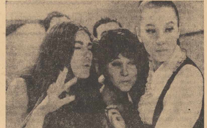
Cadru din filmul „Drumuri” care rulează la cinematograful 7 NOIEMBRIE din Sibiu

Un cuib de nobili (orele 10,00; 16,00; 18,00 și 20,00). CISNĂDIE: POPULAR: Un cuib de nobili (orele 11,00; 16,00; 18,00 și 20,00).