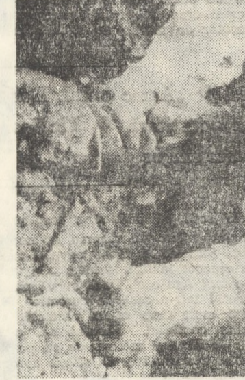
Cădru din filmul Flacăra olimpică

CINEMA SIBIU: FAȚEA: Degetul de fier (orele 9,00; 11,30; 14,00; 16,30; 19,00; 21,00); ARTA: Ghici cine vine la cină? (orele 9,30; 12,00; 15,30; 18,00; 20,30); TINERETULUI: Argoman superdiabolical (orele 10,00; 12,00; 14,30; 16,30; 18,30); INDEPENDENȚA: Flacăra olimpică (orele 11,00; 14,30; 16,30; 18,30; 20,30); 7 NOIEMBRIE: Așteptă pînă se întunecă (orele 10,00; 14,00; 16,00; 18,00 și 20,00).