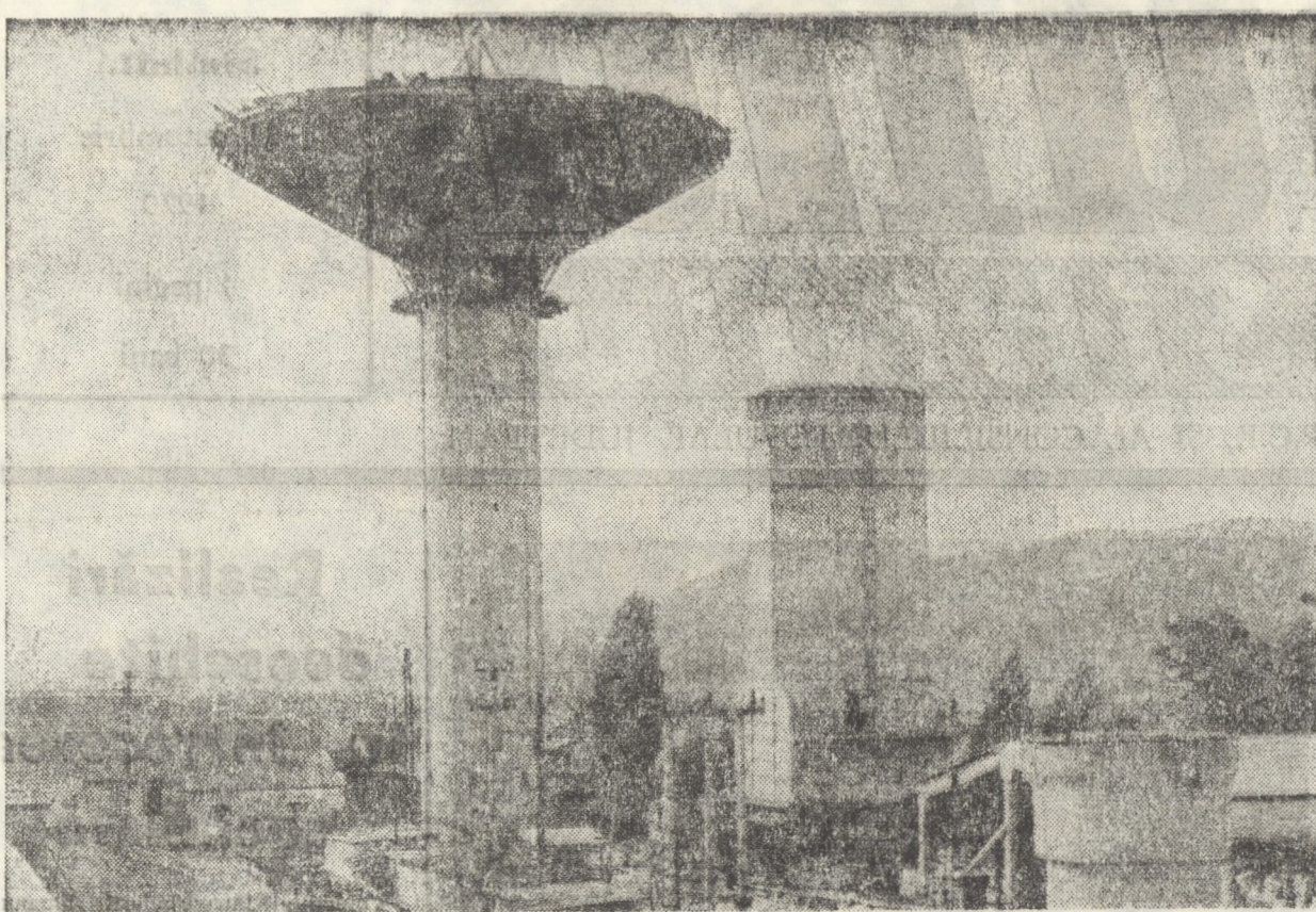
Printre lucrările de investiții importante din zona industrială a municipiului Mediaș, un loc de frunte îl ocupă castelul de apă, în curs de construcție la Fabrica de geamuri. Turnul propriu-zis are o înălțime de 42 m, avînd capacitatea de 1.000 m 3