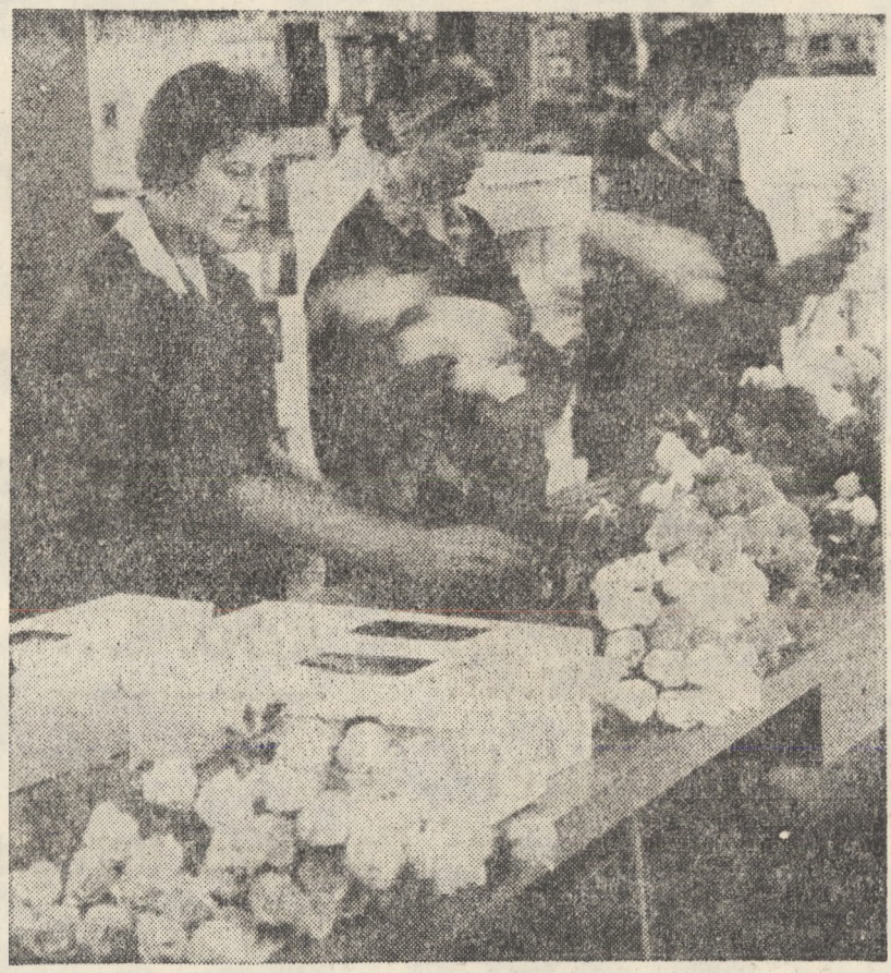
Imagine din „sera” fabricii „Flamura roșie” Sibiu, secția floriferi artifice din masa plastică. Aici „au răsărit” peste 300 000 flori diferite în luna octombrie a.c.

Uzina „Independența”, spre deosebire de perioadele anterioare, are producția anului viitor nominalizată în proporție de 91 la sută. De asemenea, documentația pentru produsele ce se vor realiza în anul viitor sub forma proiectelor de execuție, a temelor și proiectelor tehnice