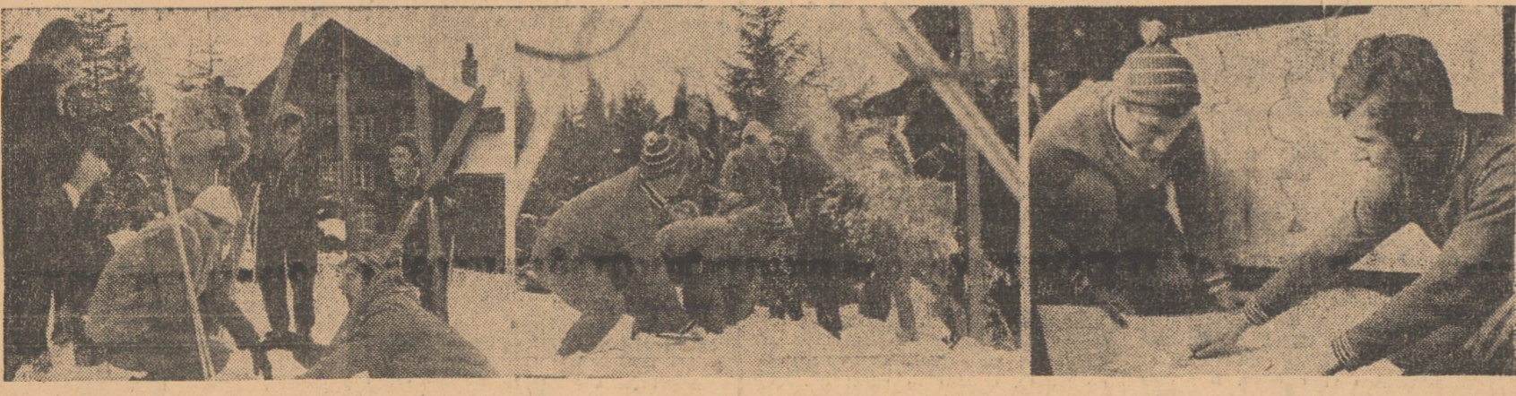
Deși zăpada abundentă în aceste zile de sfîrșit de an se lasă așteptată, buna dispoziție la bălăie cu zăpadă, la micile excursii în locurile pitorești din jurul stațiunii sau intrării în munte muzică și dans, este prezenta în toate călătoriile de vacanță și petrecerile din stațiunea climatică Păliniș, unde sute de studenți, veniți din toate colțurile țării, își petrec zilele frumoase de iarnă