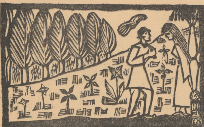
Ilustrație de Ion Cărămîdar, la volumul în curs de apariție „De n-ar fi poveștile” de Nicolae Nistor