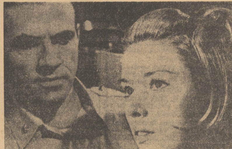
Cadru din filmul „King Kong evadează”

SIBIU: PACEA: King Kong evadează (orele 9,00; 11,30; 14,00; 16,30; 19,00; 21,00); ARTA: Valea păpușilor (orele 9,30; 12,00; 15,00; 17,30; 20,00); TINETUTULUI: Sub semnul lui Monte Cristo (orele 10,00; 12,00; 14,30; 16,30; 18,30).