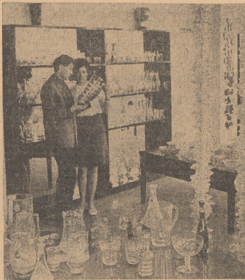
„Vitrometan” Medias. Expoziție cu produse sau locul cel mai greu de prezentat în cuvinte