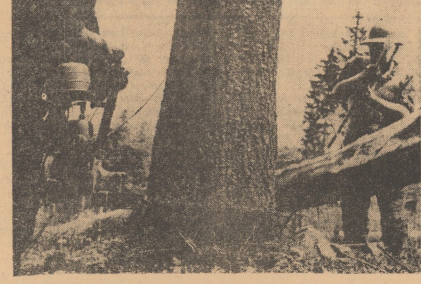
Muncitorii forestieri la lucru in Valea Sadului

stîncă. Și drumul pe care trece convoiul de camioane încărcate cu busteni e altul de îngust și aproape de pășănie încit te îngrozește. Soferul, cu un chistoc de țigară slîșă lipit de buze, face un semn mucalit din ochi, destinele frînei și alunecă mai departe însoțit de zgomotul motorului său, sigur și calm. Zilnic face patru-cinci asemenea curse de cascade, fără să mai observe că trece printr-o gură de iad.