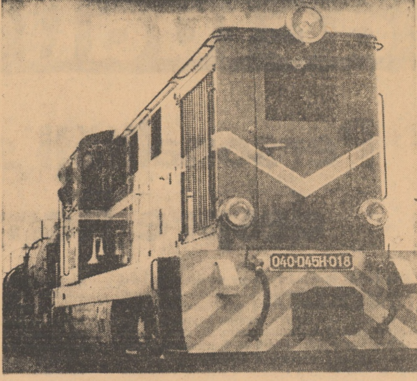
Locomotive Diesel, cu inalte performanțe tehnice, deservește astăzi și traficul pe linia C.F.R. îngustă Sibiu—Agnita

Orar prelungit Toate unitățile de coafură și frizerie — ne relatează Iosif Schöntaler, presedintele coopera- tivei „Ighena” Sibiu — sint des- chise in aceste zile de la ora 6 la ora 22. Dacă există clientela multă, obligatoriu, toți salariații contină lucrul încă o oră. Pentru zilele de 2 și 3 ianuarie vor fi deschise numai o parte din unități.