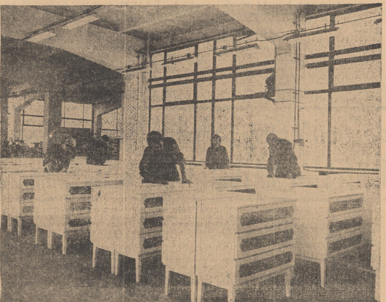
Fabrica „Republica” — aspect din hala de finisaj mobilă.

Faptul că anul 1970 s-a încheiat cu rezultate revelatoare pentru activitatea Consiliului popular al municipiului Sibiu — mai ales în compartimentul edilitar-urbanistic — sesuina consideră că în 1971 cota realizărilor poate și trebuie să crească. Astfel, organizarea științifică adecvată a situațiilor concrete, specific Sibiului, folosirea rațională și intensivă a rezervei materiale și umane de care dispunem va duce la sporirea beneficiilor peste plan în întreprinderile economice, la dezvoltarea rețelei comerciale — în același timp la obținerea unor importante reduceri la cheltuielile de circulație a mărfurilor — precum și la efectuarea unui însemnat volum de lucrări cu muncă patrioțică. Dar, pentru ceea ce va însemna anul 1971 în activitatea socială, obstacolele a cetățenilor Sibiului, angajamentele formulate în Răspunsul la chemarea la întrecere patriotică lansată de Consiliul popular al municipiului Medias.