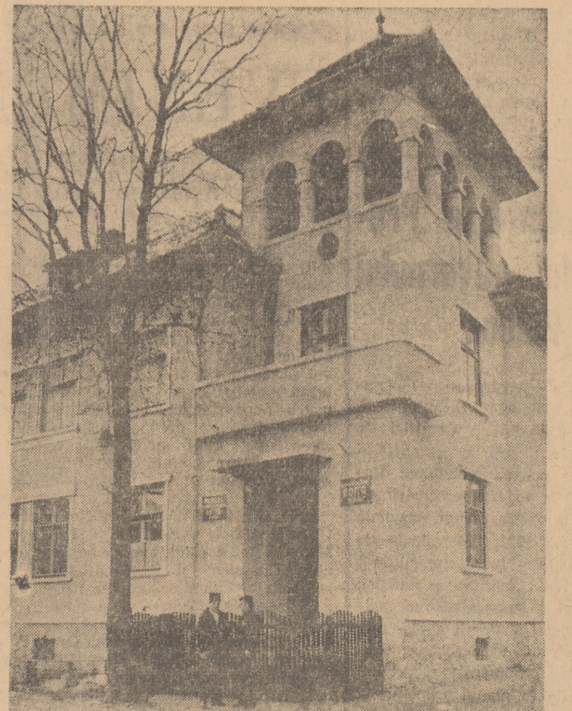
Căminul cultural și Muzeul istorico-etnografic din Boia

— Prin transformarea, în 1970, a Secției de științe sociale Sibiu a Filialei Cluj a Academiei Republicii Socialiste România în Centrul de științe sociale al Academiei de Științe Sociale și Politice, s-a creat o bază mai precisă fundamentată pentru cercetarea științifică locală. În urma activității desfășurate de nucleul de cercetători, în perioada 1966—1970, au fost tipărite un număr de 56 de titluri de publicații.