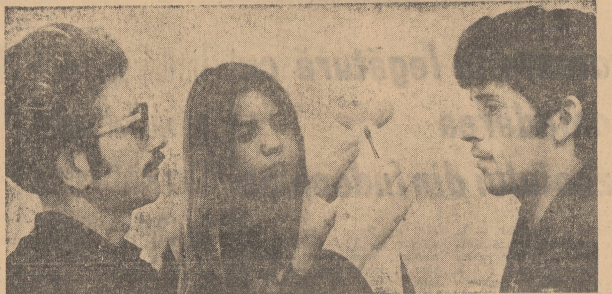
In clasa artă decorativă a Școlii populare de artă din Sibiu