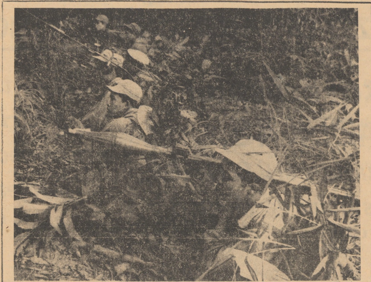
În foto: Patrioți din Frontul Național de Eliberare din Laos, în timpul unui atac împotriva bazelor militare inamice

Washington 6 (Agerpres). — Senatorul democrat Edward Kennedy a cerut din nou guvernului S.U.A., adresîndu-se Conferinței asupra politicii Statelor Unite față de China, organizată de membri ai Congresului american, să promoveze o politică realistă față de Republica Populară Chineză. El s-a pronunțat pentru „abandonarea împotrivirii S.U.A. față de restabilirea drepturilor R.P. Chineze la O.N.U.”. Subliniind că „era de mult timp pentru recunoașterea diplomatică a Pekinului și repre-