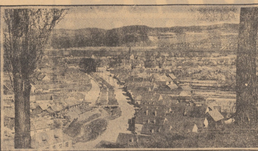
Din pisajul comunelor județului Sibiu: Tîrnava

Duminică dimineața, în sala Consiliului popular municipal vor începe lucrările conferinței municipale a organizației pionierilor, secțiunea pentru adulți, la care, pe lângă reprezentanți ai organizațiilor municipale, ai Comitetului superior de partid vor participa delegați din școli, conducători de detașamente.