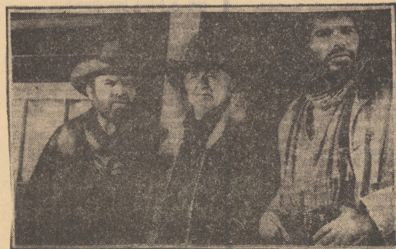
Cadru din filmul SPRÎJINI-I PE ȘERIF

BAZNA-BĂI: Flacăra olimpică (orele 17,00 și 19,00).