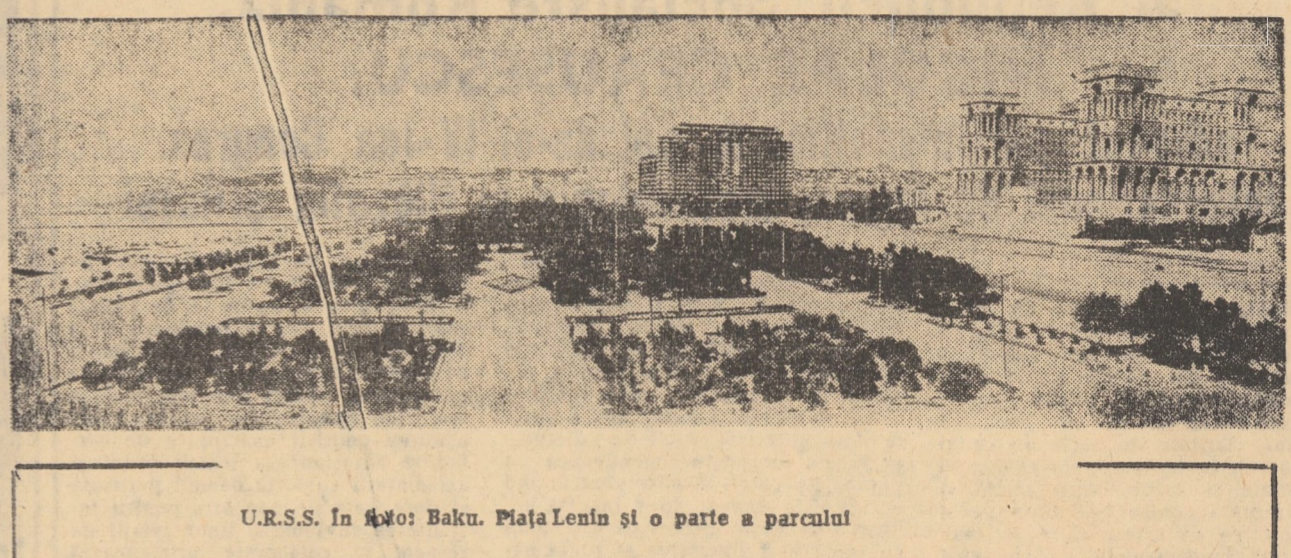
U.R.S.S. în Azerbaidjan: Baku. Piața Lenin și o parte a parcului

Partizanii unui reformism mai îndrăzneț, merit să deconționeze economia și mentalitățile, să zdrobească rămășițele sistemului feudal și ciocnesc de interesele celor instalați la conducerea partidului și a statului. „Ceea ce denumim democrația noastră este în realitate guvernul celor boğați, ales de boğați, pentru boğați”, se afirmă într-un raport al Mișcării social-cristine. Or, revenind la atentatul de la 21 august, dacă se ajunge la o ciocnire „a boğaților”, aceasta reflectă, în realitate, o simplă luptă de clan, care nu are nici o legătură cu mîile de locuitori ai Manila ce trăiesc în condiții inumane, alături de cartiere scotite printre cele mai luxuase din lume. În aceste condiții, atentatul respectiv nu ar fi avut nici o semnificație profundă dacă el nu ar fi dat președintelui ocazia de a încerca reprimirea întregii opoziții, fără deosebire.