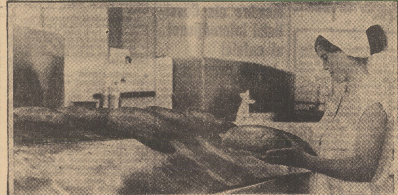
Imagine cotidiană la Complexul de moritur și panificație Sibiu: o nouă șarjă de pline părește cuprul automat

În comuna Șura Mare a început să funcționeze o nouă brutărie, cu o capacitate de 700 kg pline pe zi, care aprovizionează pe lângă satele aparținătoare, și magazinul intercooperatist deschis recent la Sibiu. Alte unități similare, ale Uniunii județene a coo-