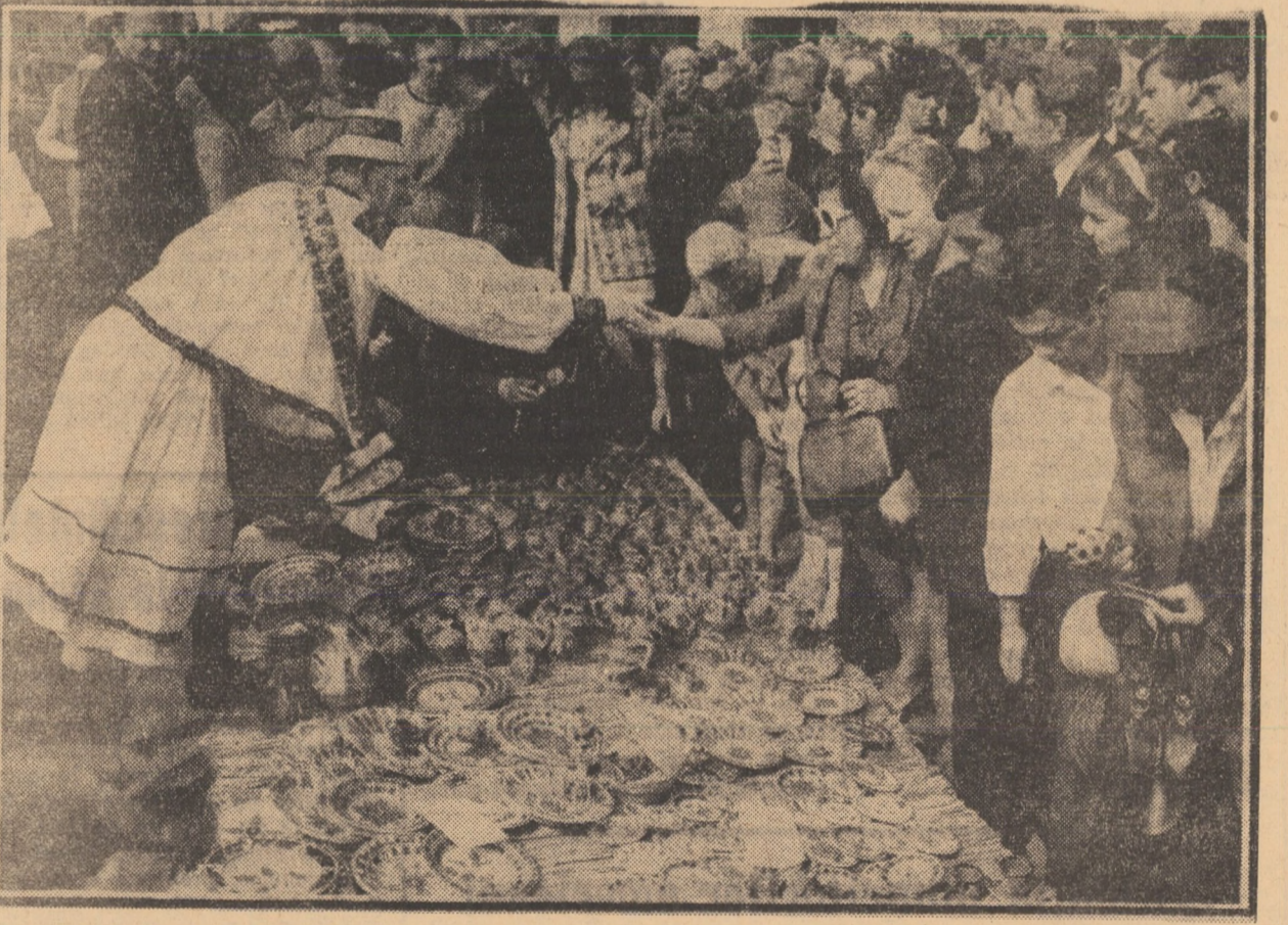
Aspectul surprins în imaginea noastră, de la ediția din anul trecut a festivalului, dovedește cu prisosință interesul deosebit de care se bucură în rîndul populației sibiene tirgul olarilor