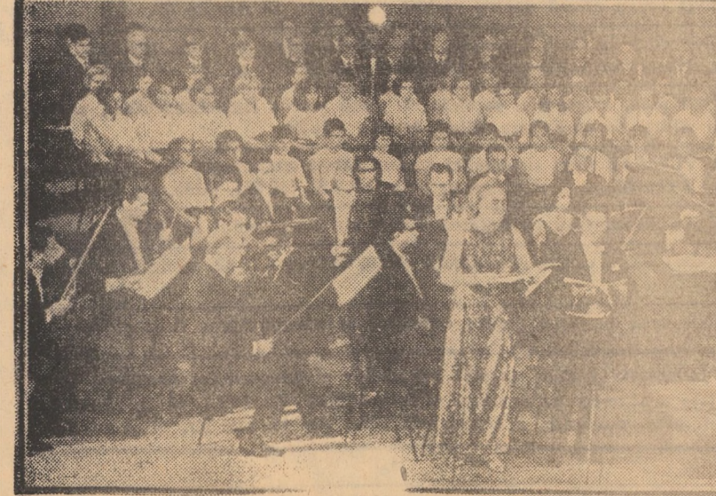
Corul Bach: spectacol prezentat la „Cibinium” ’74