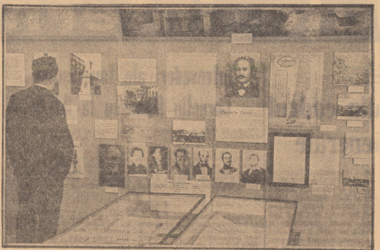
Într-una din încăperile muzeului din Avrig sînt expuse diferite manuscrise și documente, fotografiile etc., privind viața și activitatea dascălului Gheorghe Lazăr