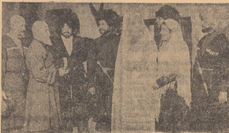
Cadru din filmul CERMEN, care rulează la cinematograful „Tineretului” din Sibiu

CISNĂDIE: POPULAR: Sunetul muzicii, seriile I și II (orele 10,30; 17,00 și 20,00).