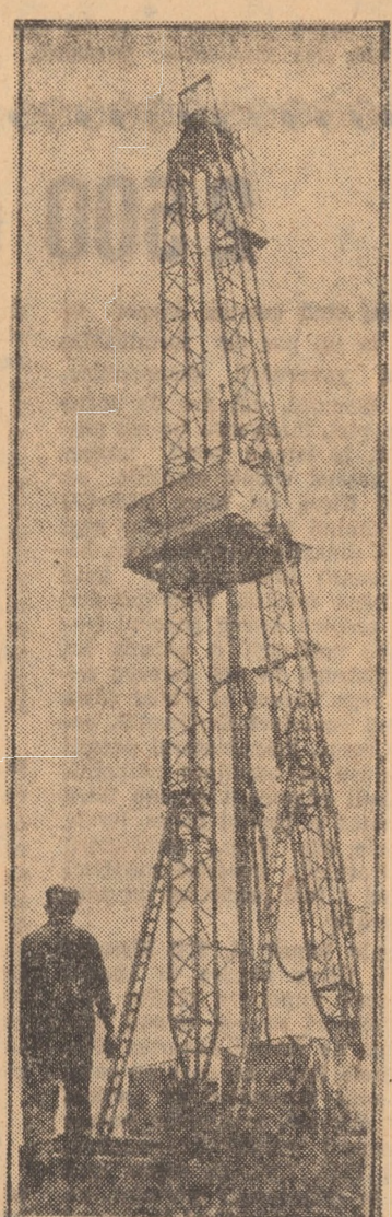
Una din multiplele instalații de foraj

Secvență col... la una din stațiile din vastul evantai al magistralelor pentru transportul gazului metan