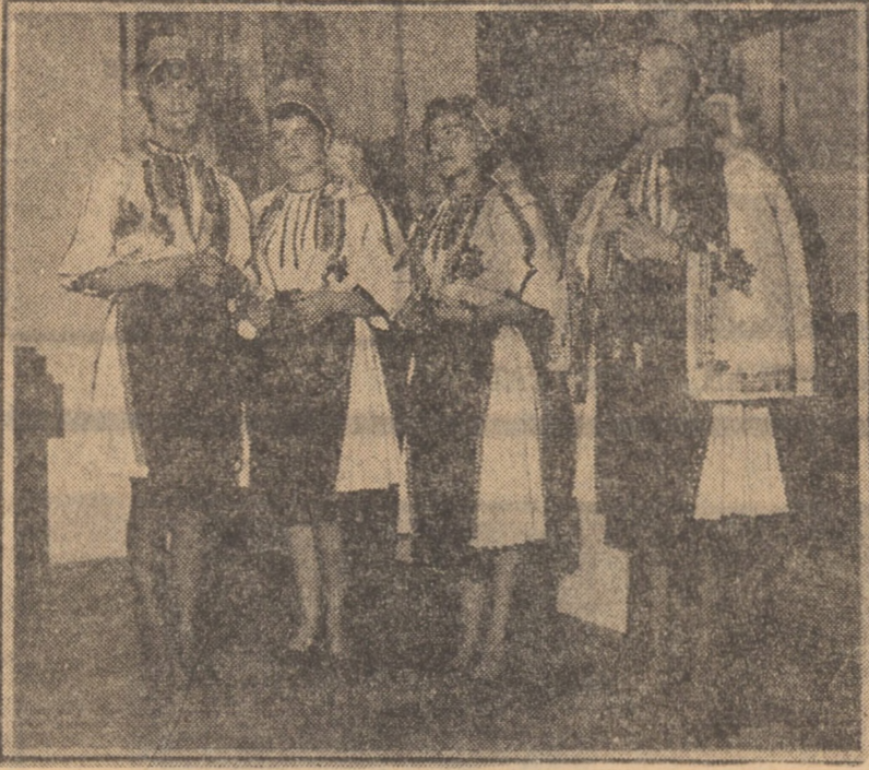
În frumosul port sălilean