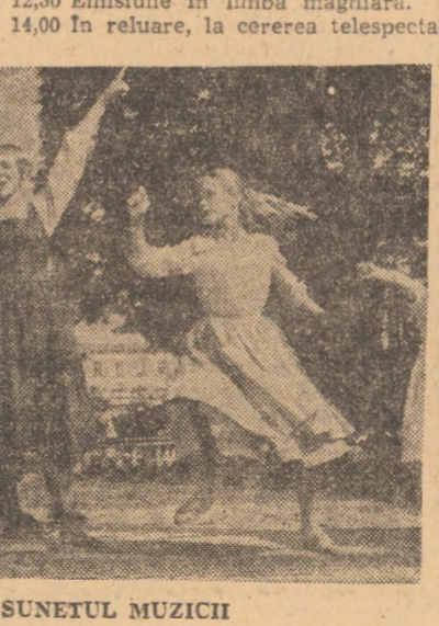
Cadru din filmul SUNETUL MUZICII

OCNA SIBIULI: Pași spre lună (orele 17,00 și 19,00); TELEZIUNE 8,30 Deschiderea emisiunii. Sport și sănătate. 9,00 Matinee duminicală pentru copii. Film serial: Sebastian și secretul epavei (III). Episodul: „Domnișoara Sophie Virginică”.