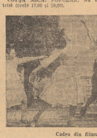
Cadru din filmul SUNETUL MUZICII

HALDUCII (orele 10,00; 14,00; 16,00; 18,00; 20,00); INDEPENDENȚA: Meridianul zero (orele 11,00; 14,30; 16,30; 18,30; 20,30); MEDIAS: PROGRESUL: Asedul (orele 9,00; 11,15; 14,00; 16,30; 19,00; 21,15); TINERETUL ȘI CEMEN (orele 10,00; 16,30; 18,30; 20,30); UNIREA: Fiecare partidului (orele 10,00; 16,00; 18,00; 20,00); CISNĂDIE: POPULAR: Sunetul muzicii, seriile I și II (orele 11,00; 14,00; 17,00 și 20,00); AGNITA: 8 MAI: Evocări (orele 10,00; 18,00); DUMBRĂVENI: 7 NOIEMBRIE: Neamul Soimăreștilor (orele 16,00 și 20,00); COȘEA MICĂ: POPULAR: Nu fi trist (orele 17,00 și 19,00).