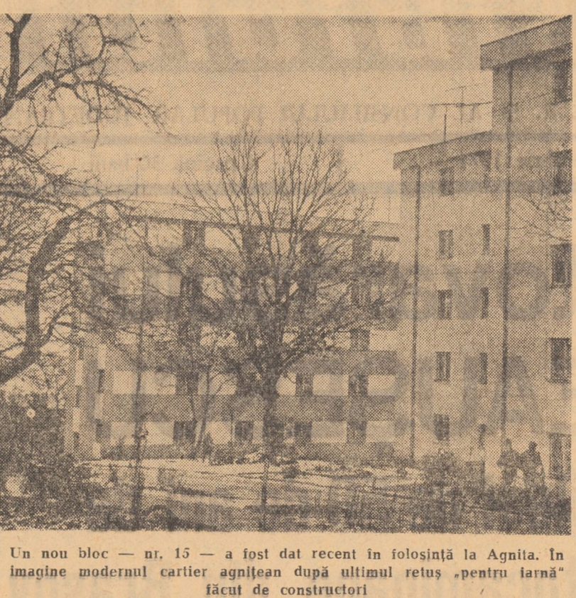
Un nou bloc — nr. 15 — a fost dat recent în folosință la Agnita. În imagine modernul cartier agnitean după ultimul rețuș „pentru iarnă” făcut de constructori

active în perioada hotărî-toare a construcției so-cialiste de noi. Sint viu în mintea mea suc-cese reputeate de corul „Guttenberg” în schim-burile de experiență cu tipografilor din București, de la Casa Școlii, în-treprinderea poligrafică „13 Decembrie”, în-treprinderea Poligrafică nr. 4, cu cel din Brașov,