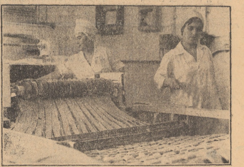
Intr-una din secțiile fabricii „Victoria” din Sibiu, o mașină de divizat și așezat aluat la cuplor realizează azi o producție sporită. Urmăjii fiind conceput în întregime prin autoutilare, aduce o eficiență economică de peste 300 000 lei anual.

ca depusă. Totodată, un număr de cooperative au de achitat credite restante de mai mulți ani, unele de peste 10 ani. Această situație influențează, an de an, negativ asupra activității acestora.