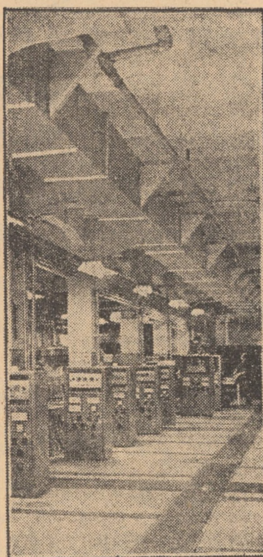
Secvență din sala mașinilor cu injecții a secției stiloirilor de la „FLARO”, Sibiu