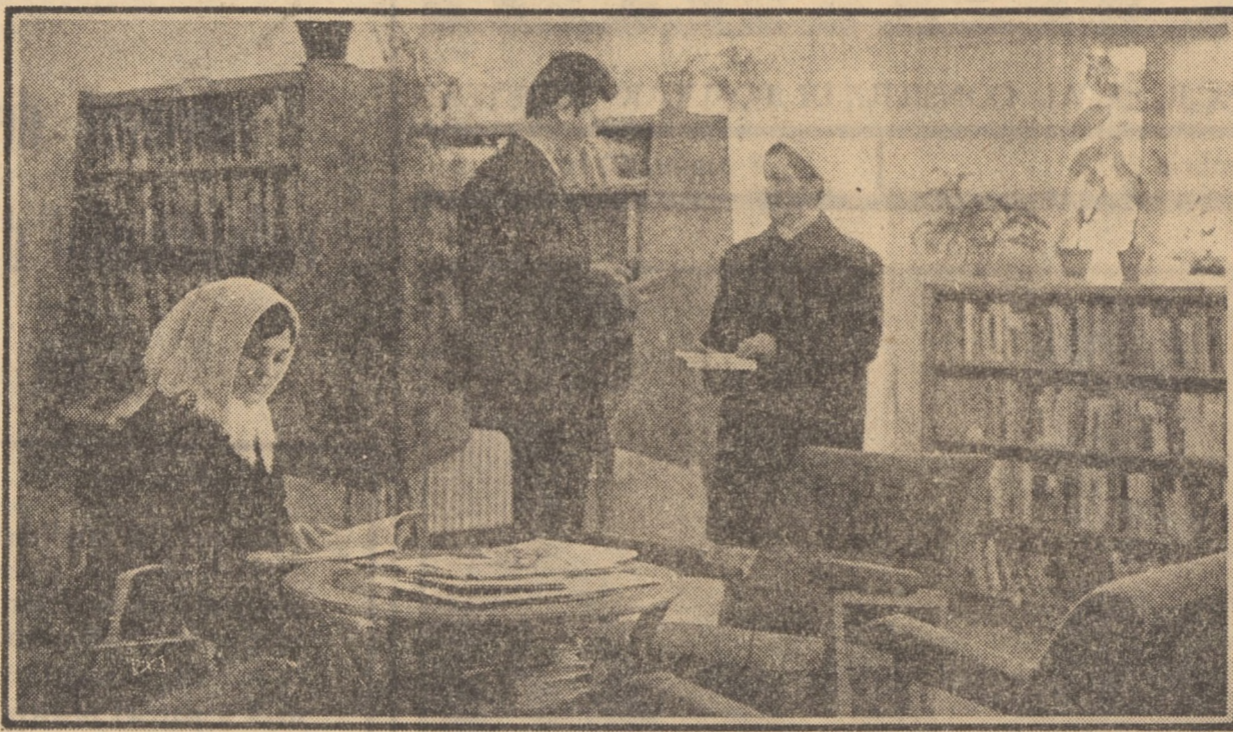
Cadru din biblioteca Casei de cultură din Cisnădie, unde, de la începutul anului și până în prezent au fost citite 21 000 cărți de către 1 200 cititori