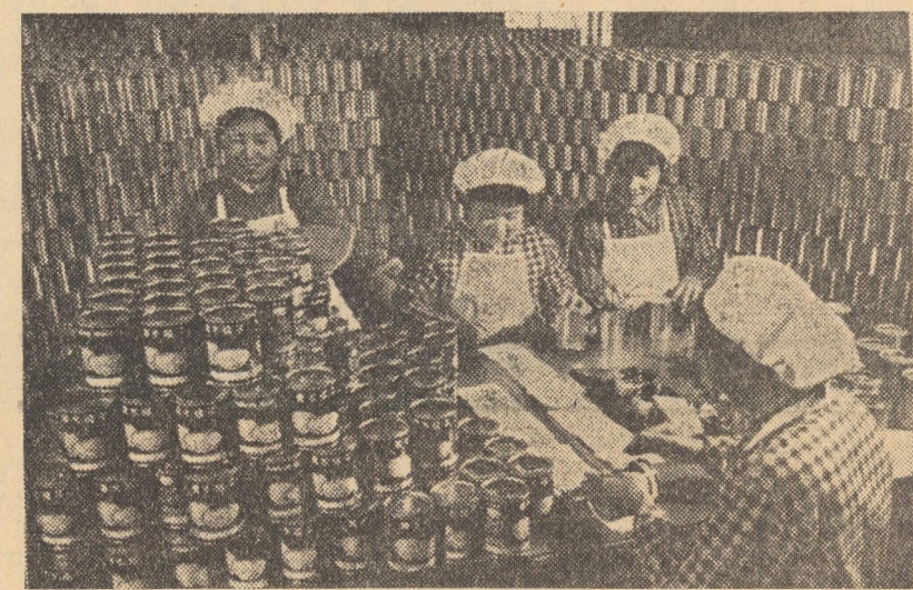
În R.P. Chineză, dezvoltarea industriei grele a facilitat dezvoltarea industriei ușoare. În foto: Aspect dintr-o fabrică de conserve din Huangyen, provincia Chekiang

Însotit de președintele Camerei Deputaților și Senatului, șeful statului s-a prezentat în fața Parlamentului reunit în ședință solemnă la Palazzo Montecitorio (segiul Camerei Deputaților), pentru a depune jurămîntul. Erau prezenți membrii guvernului, înalte oficialități civile și militare ale statului, membrii corpului diplomatic, ziaristi.