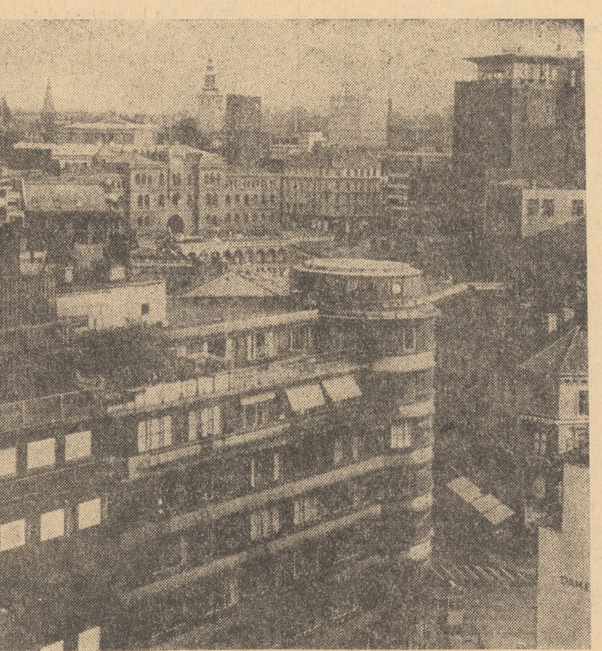
Norvegia este un regat situat în nordul Europei, întemeiat în 860. În 1905 după ce a fost uniune personală cu Suedia, Norvegia a devenit staț suveran. Capitala țării se află la Oslo care are 598.515 locuitori împreună cu suburbiile (1960). În foto: Vedere parțială din Oslo

NAVA TURISTICĂ EGIPTEANĂ „HASSED HEIR”, care efectua un circuit al monumentelor egiptene situate pe Nil, între Cairo și Assuan, cu 87 turiști străini la bord, a fost cuprinsă de flăcări și s-a scufundat în apele fluviului la Edu, ca urmare a unui incendiu izbucnit în bucătăria vasului. Doisprezece membri ai echipajului au fost ucisi, iar alți 65 au suferit răniri și au fost de grad diferite. Patru turiști au fost ușor răniți, fiind evacuați cu trenul la Cairo.